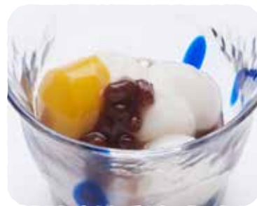
▶ 白玉ぜんざい 500円(税込550円)