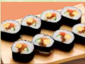
▶中巻 1人前 960円 (税込1,056円)