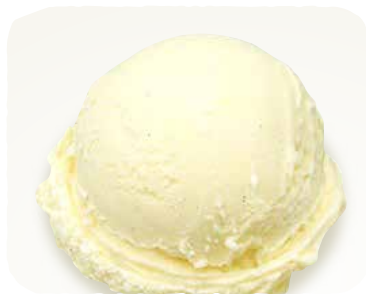
▶ バニラアイス 200円(税込220円)