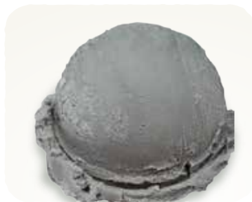
▶ ごまアイス 230円(税込253円)