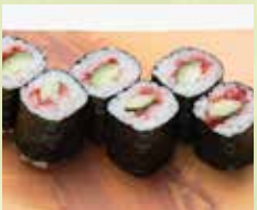
▶梅きゅう巻 350円 (税込385円)