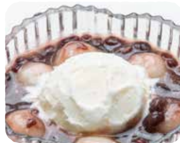
▶ 白玉バニラぜんざい 600円(税込660円)