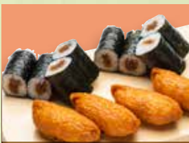
▶のりいなり (のり巻2本、いなり4ヶ) 920円 (税込1,012円)