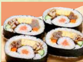
▶太巻 1人前 1,150円 (税込1,265円)