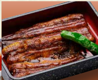
◎国産上りなぎ蒲焼き 4,500円(税込4,950円)