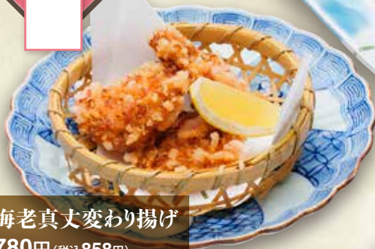
◎海老真丈変わり揚げ 780円 (税込858円)