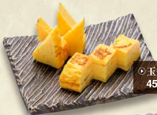
▶ 玉子つまみ 450円 (税込495円)