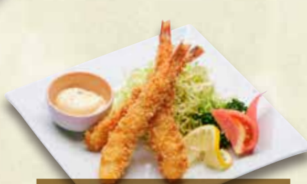
◎えびフライ 1,400円(税込1,540円)