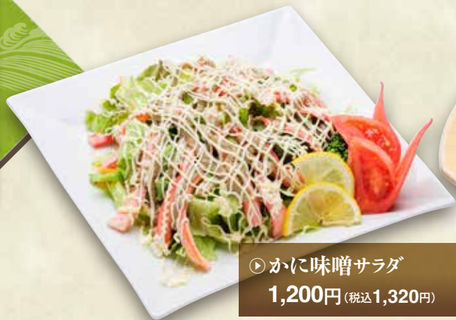
▶ かに味噌サラダ 1,200円 (税込1,320円)