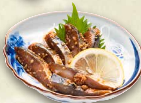
◎ごま鯖つまみ 800円 (税込880円)