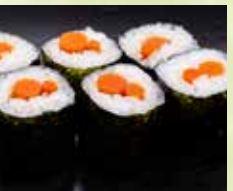
▶ごぼう巻 300円 (税込330円)