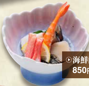
▶ 海鮮酢の物 850円 (税込935円)