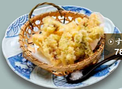
▷する天 780円 (税込858円)