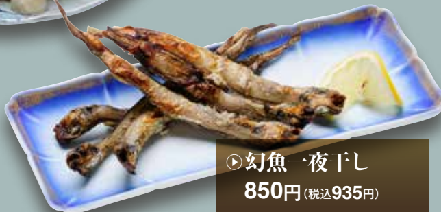
▷幻魚一夜干し 850円 (税込935円)