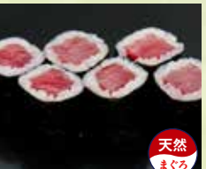
▶鉄火巻 650円 (税込715円)