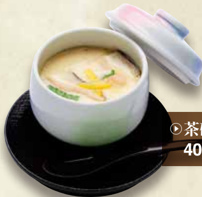
▶ 茶碗蒸し 400円 (税込440円)