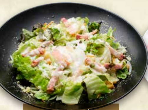
▶ シーザーサラダ 600円 (税込660円)