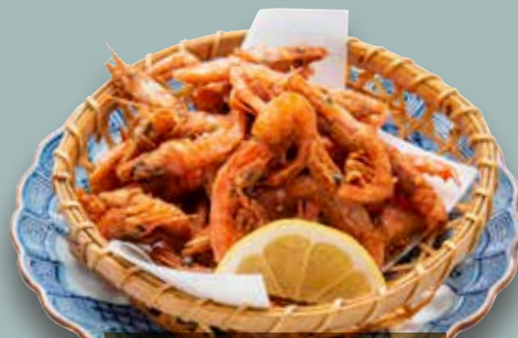
▷南蛮海老唐揚 780円 (税込858円)