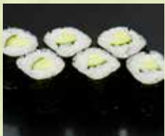
▶かっぱ巻 250円 (税込275円)