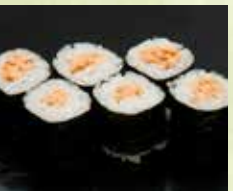
▶納豆巻 250円 (税込275円)