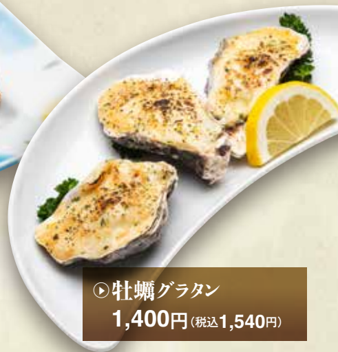
◎牡蠣グラタン 1,400円 (税込1,540円)