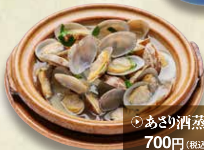
▶ あさり酒蒸し 700円 (税込770円)