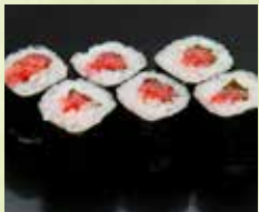
▶梅しそ巻 350円 (税込385円)