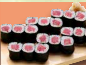
▶鉄火巻 1人前 (3本) 1,950円 (税込2,145円)