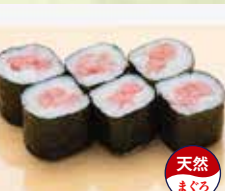
▶大とろ鉄火巻 1,700円 (税込1,870円)