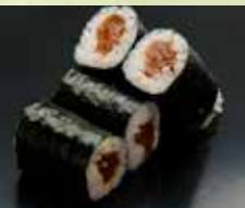
▶かんぴょう巻 300円 (税込330円)