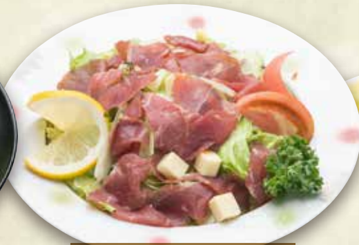
▶ 牛生ハムサラダ 850円 (税込935円)