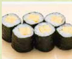
▶玉子巻 250円 (税込275円)