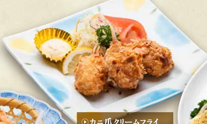
◎カニ爪クリームフライ 950円 (税込1,045円)