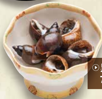
▶ 黒バイ貝旨煮 700円 (税込770円)