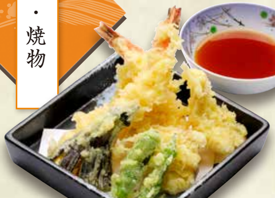
◎天ぷら盛り合わせ 1,200円(税込1,320円)