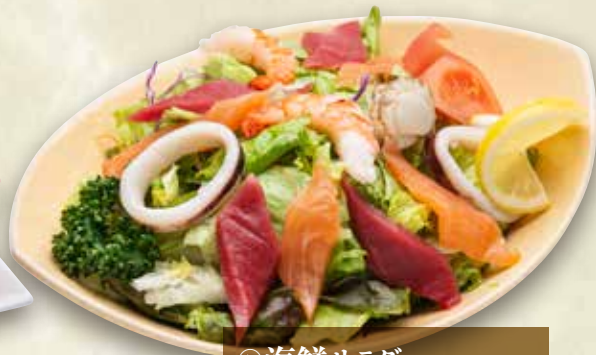
▶ 海鮮サラダ 980円 (税込1,078円) ハーフ 780円 (税込 858円)