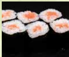
▶たらこ巻 350円 (税込385円)