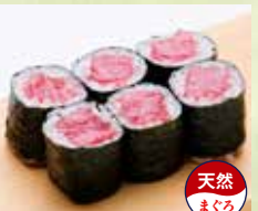
▶中とろ鉄火巻 1,300円 (税込1,430円)