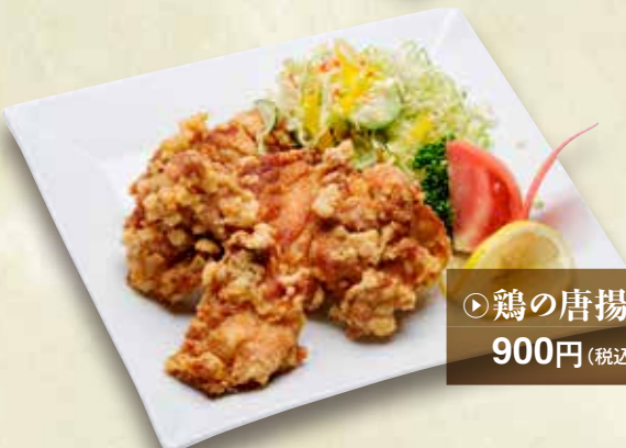
◎鶏の唐揚 900円(税込990円)