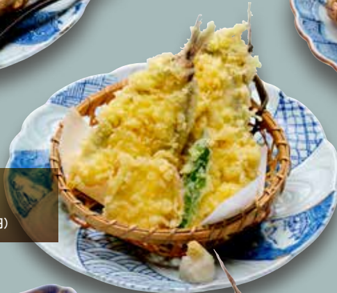
▷めぎす天ぷら 730円 (税込803円)