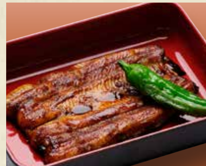
◎国産りなぎ蒲焼き 2,400円(税込2,640円)