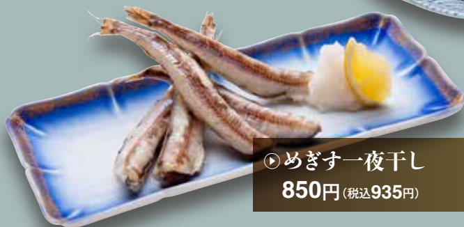
▷めぎす一夜干し 850円 (税込935円)