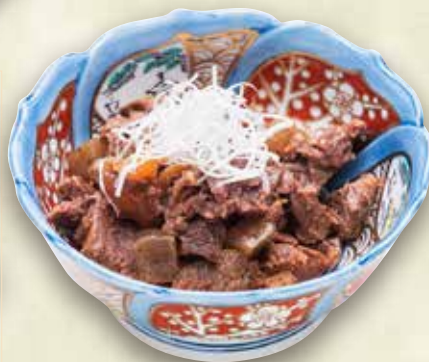
◎国産牛すじ煮込み 850円 (税込935円)