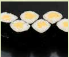
▶お新香巻 250円 (税込275円)