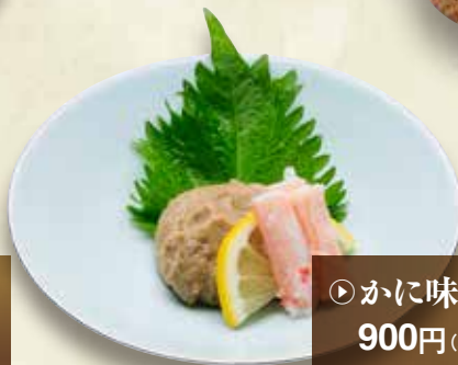
▶ かに味噌つまみ 900円 (税込990円)