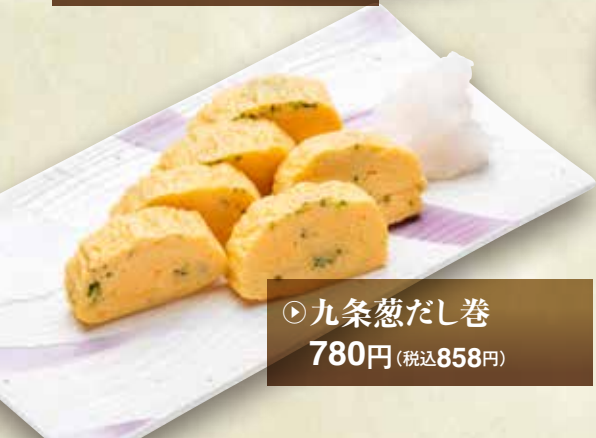
◎九条葱だし巻 780円 (税込858円)