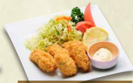
◎かきフライ 900円(税込990円)