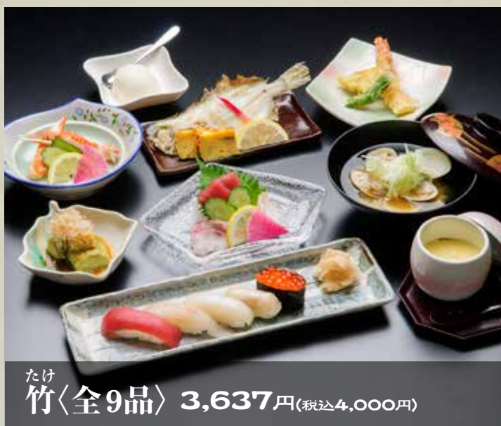
たけ 竹〈全9品〉 3,637円(税込4,000円)