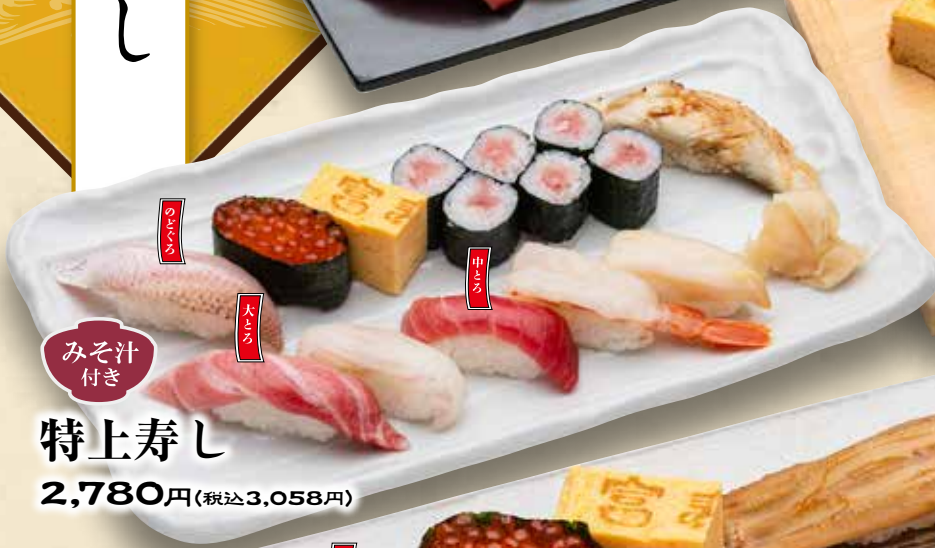
特上寿司 みそ汁付き 2,780円(税込3,058円)