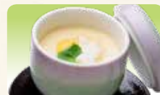
◆茶碗蒸し 通常300円のところ (税込330円のところ) 100円(税込110円)