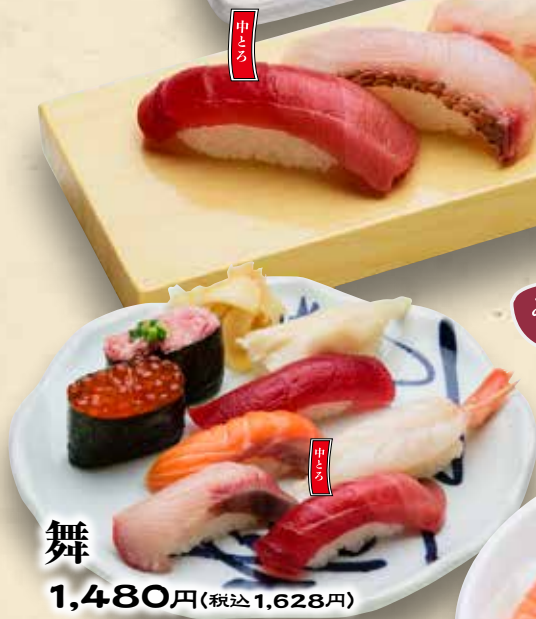
舞 みそ汁付き 1,480円(税込1,628円)