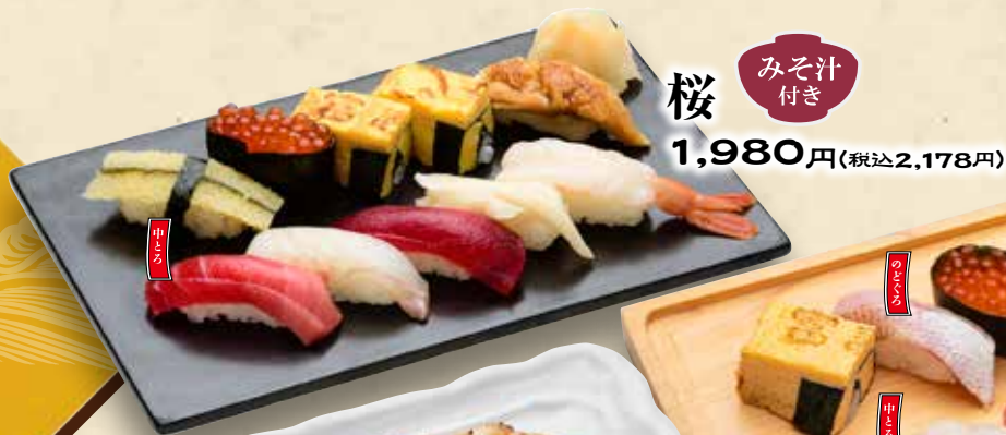
桜 みそ汁付き 1,980円(税込2,178円)