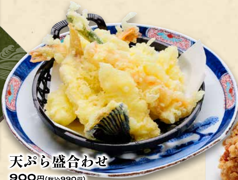
天ぷら盛合わせ 900円(税込990円)