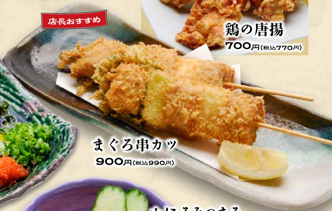
まぐろ串カツ 900円(税込990円)