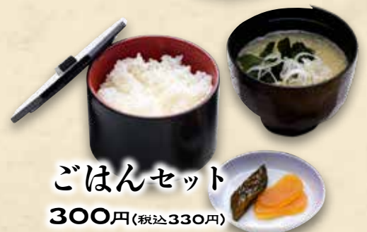
ごはんセット 300円(税込330円)