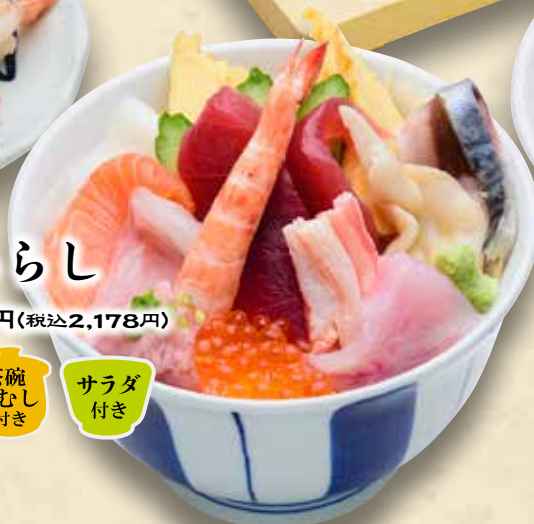
大漁ちらし みそ汁付き 茶碗むし付き サラダ付き 1,980円(税込2,178円)