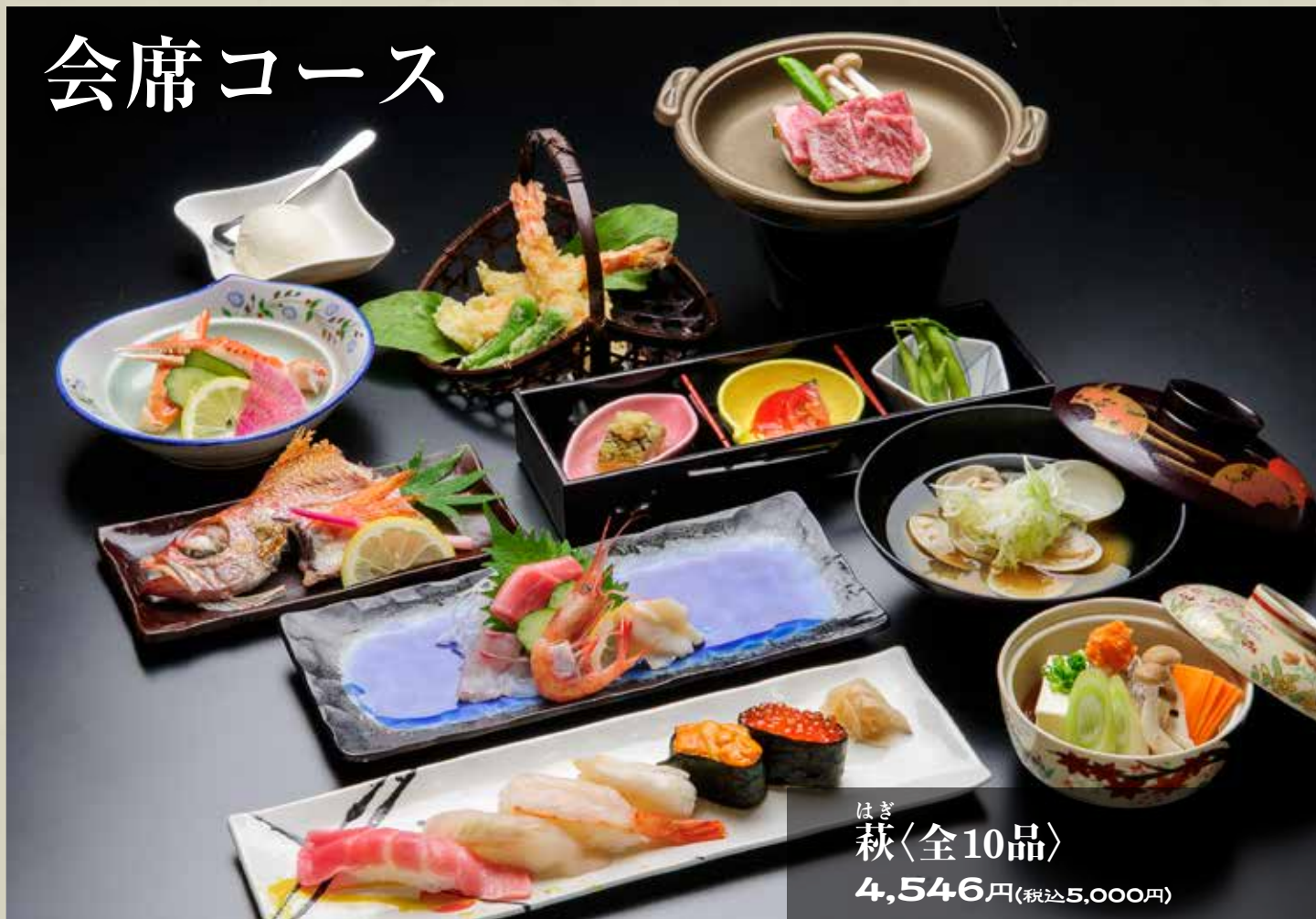
ほぎ 萩〈全10品〉 4,546円(税込5,000円)