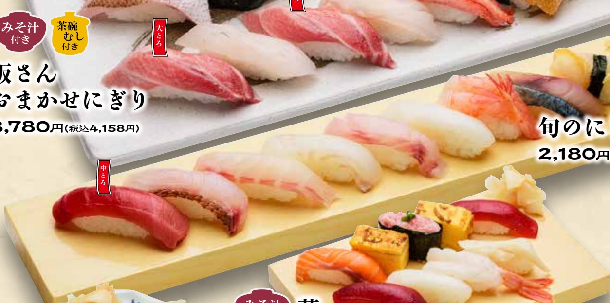
旬のにぎり あら汁付き 2,180円(税込2,398円)