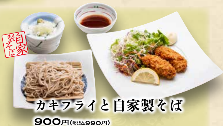
カキフライと自家製そば 900円(税込990円)