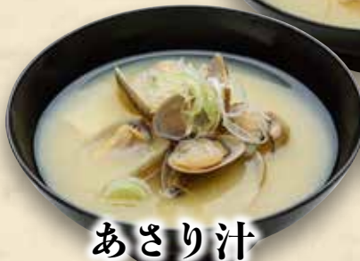
あさり汁 380円(税込418円)