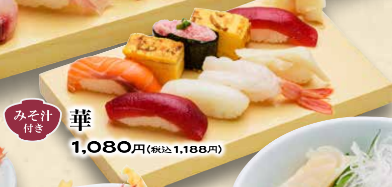
華 みそ汁付き 1,080円(税込1,188円)