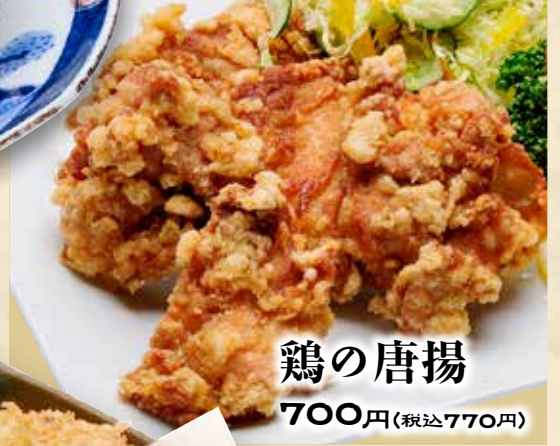
鶏の唐揚 700円(税込770円)