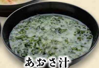
あおさ汁 350円(税込385円)