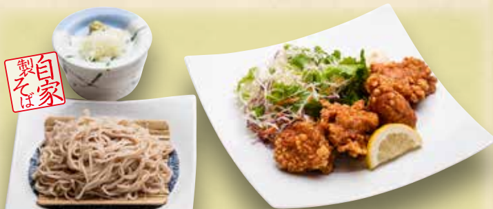
鶏の唐揚げと自家製そば 850円(税込935円)