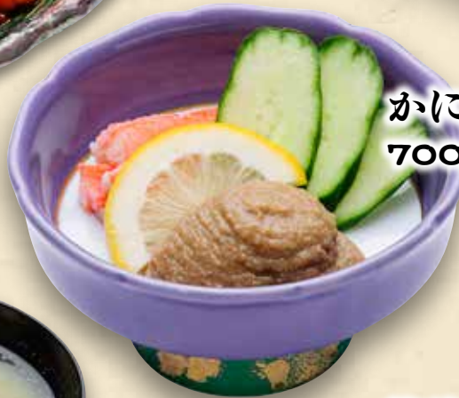
かにみそつまみ 700円(税込770円)