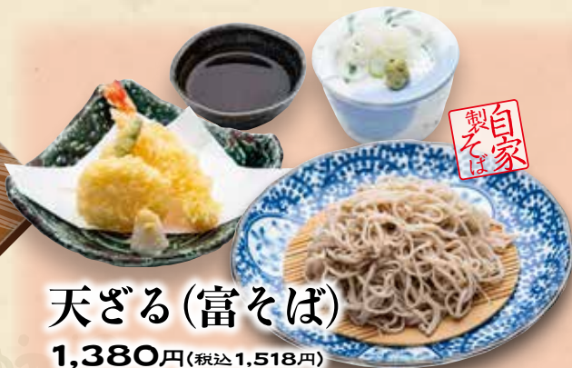
天ざる(富そば) 1,380円(税込1,518円)