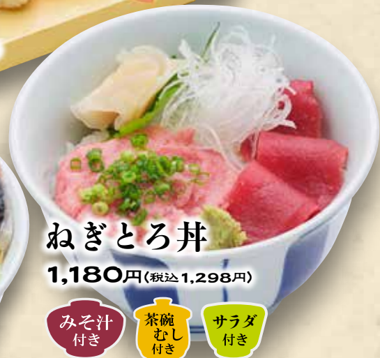
ねぎとろ丼 みそ汁付き 茶碗むし付き サラダ付き 1,180円(税込1,298円)