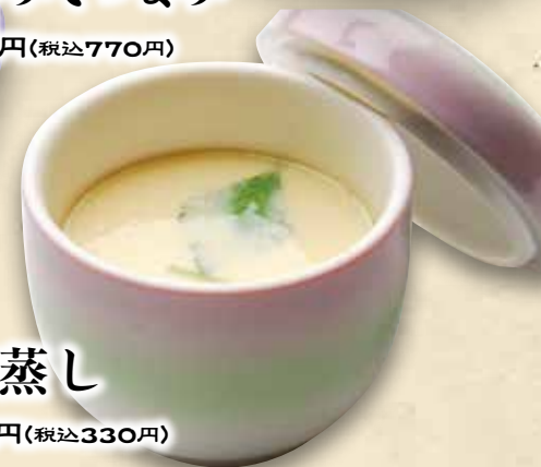
茶碗蒸し 300円(税込330円)