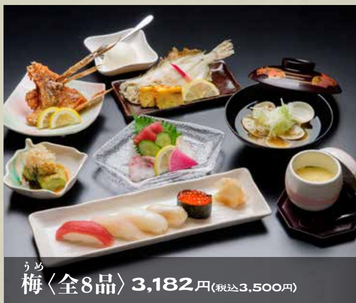
うめ 梅〈全8品〉 3,182円(税込3,500円)