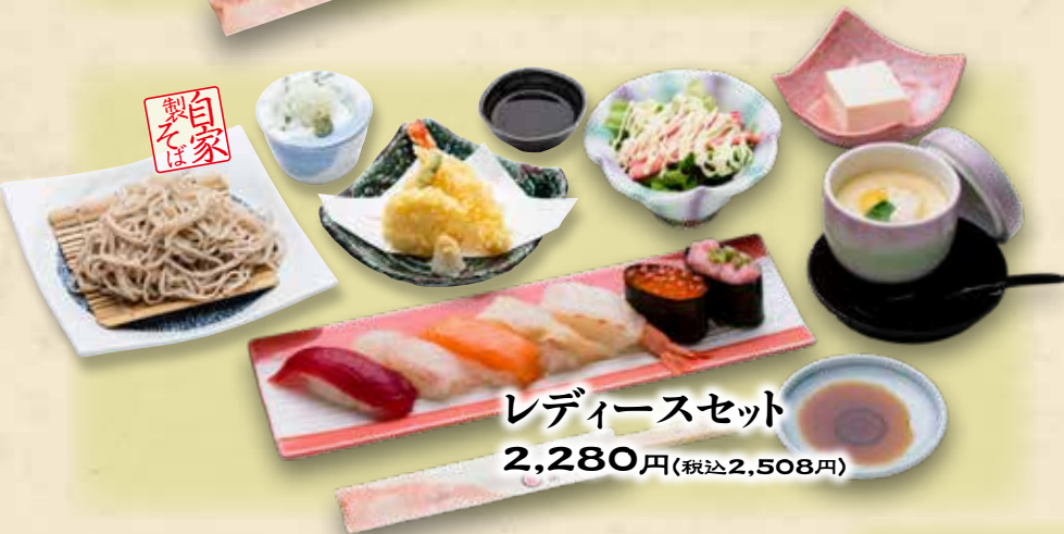
レディースセット 2,280円(税込2,508円)