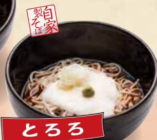
とろろ ぶっかけそば 680円(税込748円)