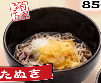
たぬき ぶっかけそば 680円(税込748円)