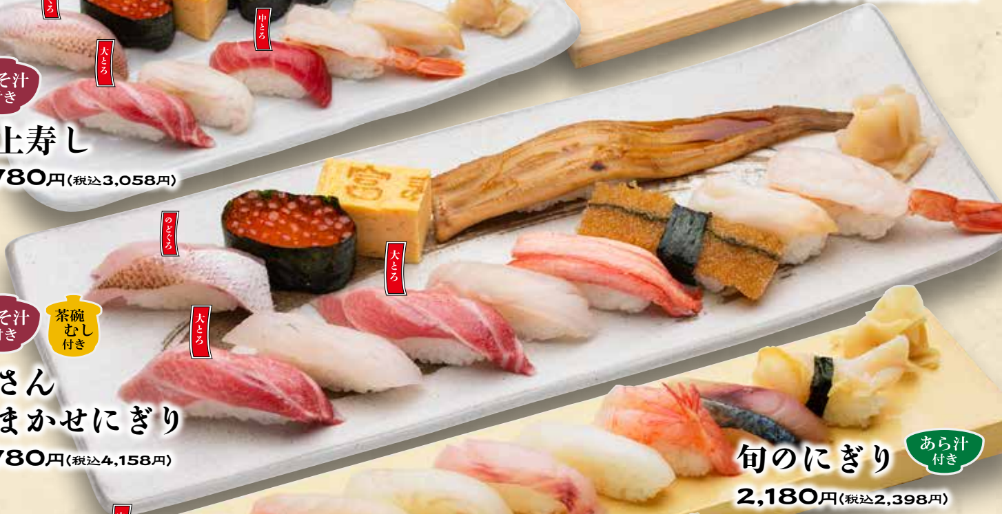
板さんおまかせにぎり みそ汁付き 茶碗むし付き 3,780円(税込4,158円)