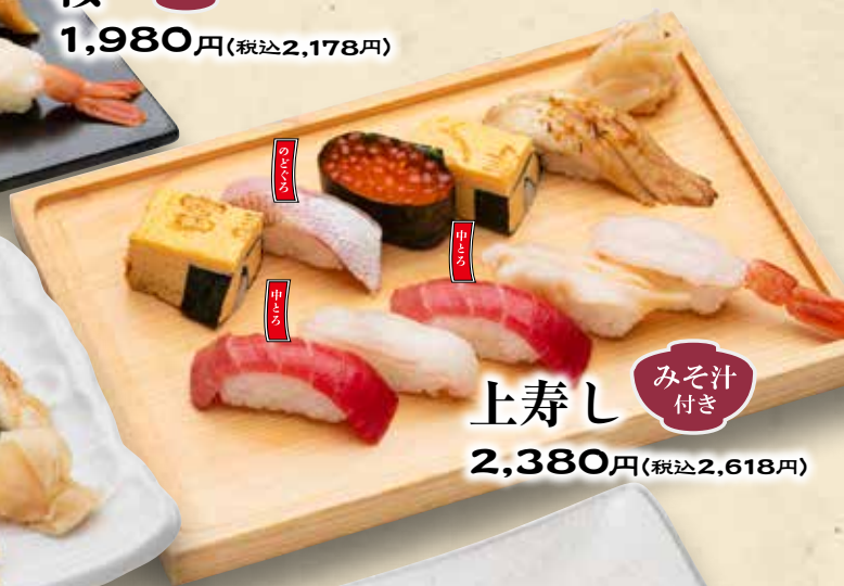
上寿司 みそ汁付き 2,380円(税込2,618円)