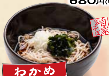
わかめ ぶっかけそば 680円(税込748円)