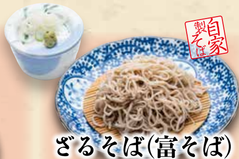
ざるそば(富そば) 780円(税込858円)