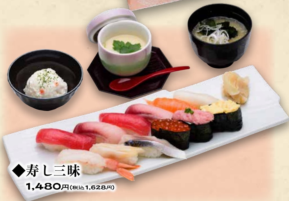
◆寿し三味 1,480円(税込1,628円)