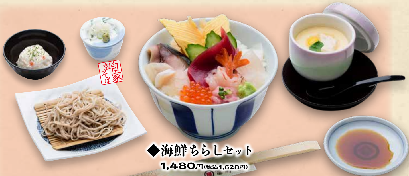
◆海鮮ちらしセット 1,480円(税込1,628円)