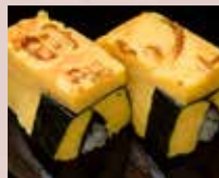
玉子 Japanese Omelette 日式煎蛋