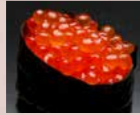
いくら Salmon Roe 三文鱼籽