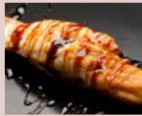
穴子 Conger Eel 星鰻