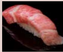
大とろ Fatty Tuna 金枪鱼大腹肉