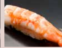
むしえび Steamed Shrimp 熟虾