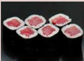
鉄火巻 450円 (税込495円) Tuna Roll 金枪鱼卷