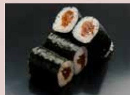
かんぴょう巻 180円 (税込198円) Dried Gourd Roll 葫芦干卷