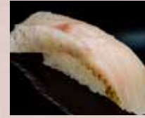
のどぐろ Blackthroat Seaperch 赤鲹鱼