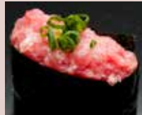
ねぎとろ Minced Tuna 香葱金枪鱼腹