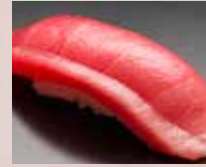
中とろ Medium Fatty Tuna 金枪鱼中腹肉