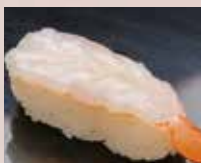
赤えび Red Shrimp 红虾