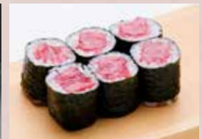
とろ鉄火 950円 (税込1,045円) Fatty Tuna Roll 金枪鱼大腹肉卷

※季節により料理内容が変わる場合もございます。 Some of the item subject to change or not available due to seasonal or stock availability. 有些项目会因不是该季节产品或无货存有所更换。