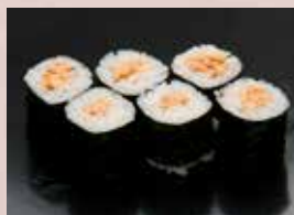
納豆巻 180円 (税込198円) Natto Roll 纳豆卷