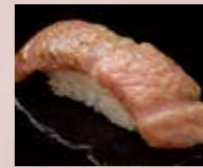
炙り大とろ Seared Fatty Tuna 火炙金枪鱼大腹肉