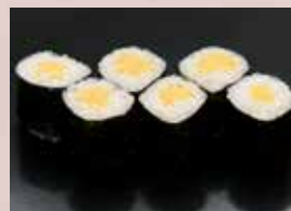
お新香巻 180円 (税込198円) Japanese Pickles Roll 腌萝卜卷