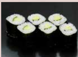
かっぱ巻 180円 (税込198円) Cucumber Roll 黄瓜卷