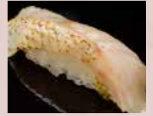
炙りのどぐろ Seared Blackthroat Seaperch 火炙赤鲹鱼