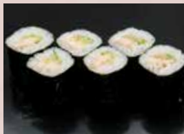
穴きゅう巻 450円 (税込495円) Conger Eel And Cucumber Roll 黄瓜星鰻卷