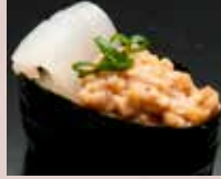
いか納豆 Squid And Natto 纳豆鱿鱼