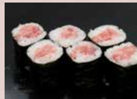
ねぎとろ巻 500円 (税込550円) Minced Tuna Roll 香葱金枪鱼腹卷