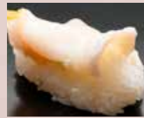
活ばい貝 Japanese Ivory Shell 日本凤螺