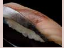
しめさば Marinated Mackerel 腌制鲭鱼