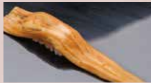
穴子一本 Conger Eel (whole pc) 星鰻 (整条)