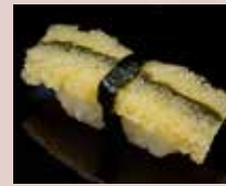
子持ち昆布 Herring Roe On Kelp 鲱鱼子海带