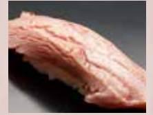
炙り中とろ Seared Tuna Belly 火炙金枪鱼中腹肉