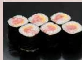
とろたく巻 500円 (税込550円) Fatty Tuna Pickled Radish Roll 腌萝卜金枪鱼腹卷