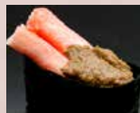
かにみそ Brown And White Crab Meat 蟹条蟹膏