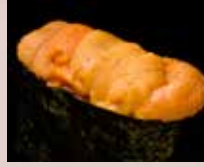
大とろ Fatty Tuna 多脂金枪鱼肚腩