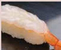
赤えび Red Shrimp 红虾