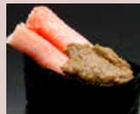
かにみそ Crab Meat & Brawn 蟹肉 蟹膏