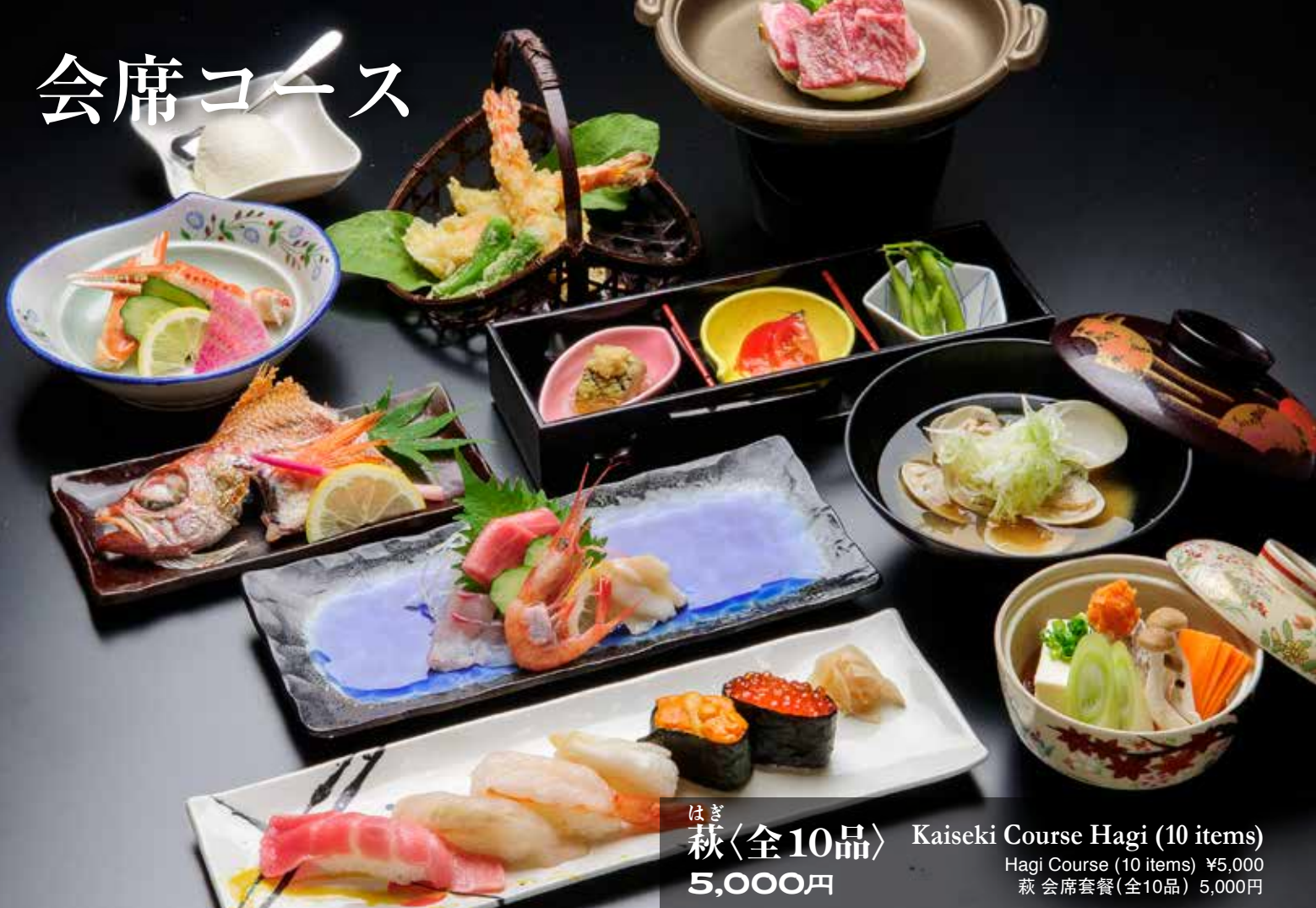
はぎ 萩〈全10品〉 Kaiseki Course Hagi (10 items) Hagi Course (10 items) ¥5,000 萩 会席套餐(全10品) 5,000円