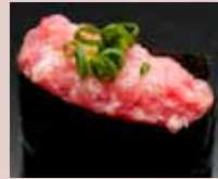
ねぎとろ Minced Tuna Belly with Spring Onion 香葱金枪鱼肚腩