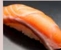
サーモン Salmon 三文鱼