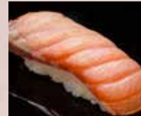
炙りサーモン Seared Salmon 火炙三文鱼