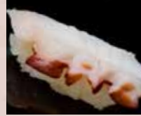
たこ Octopus 章鱼