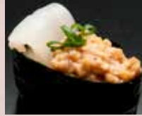
いか納豆 Squid & Natto Roll 鱿鱼纳豆卷