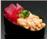
まぐろ納豆 Tuna & Natto 金枪鱼 纳豆