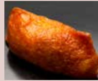
いなり Sweet Beancurd 甜油豆腐皮