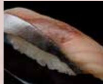
しめさば Mackerel 青花鱼