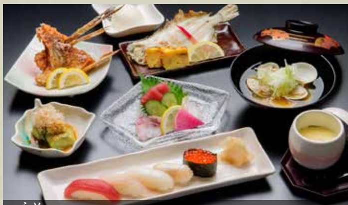
うめ 梅〈全8品〉 Kaiseki Course Ume (8 items) Ume Course (8 items) ¥3,500 梅 会席套餐(全8品) 3,500円