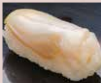
つぶ貝 Whelk 油螺