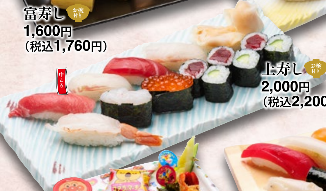
上寿司 お椀付き 2,000円 (税込2,200円)