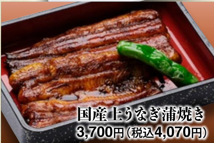
国産上りなぎ蒲焼き 3,700円(税込4,070円)