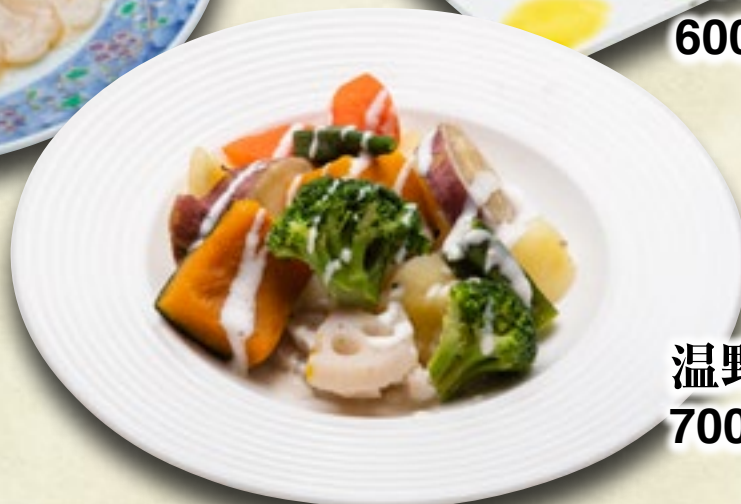
温野菜サラダ 700円(税込770円)