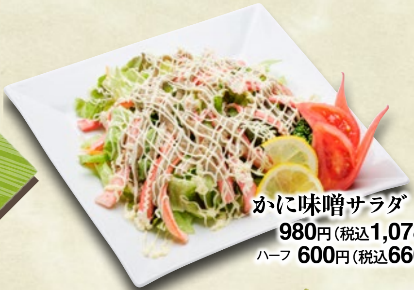
かに味噌サラダ 980円(税込1,078円) ハーフ 600円(税込660円)