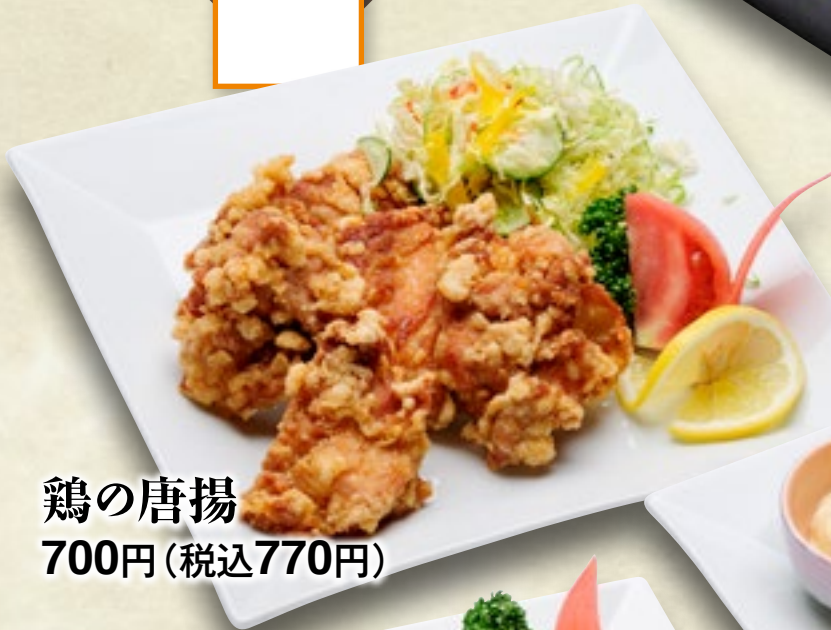
鶏の唐揚 700円(税込770円)