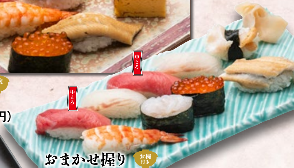
おまかせ握り お椀付き 2,600円 (税込2,860円)