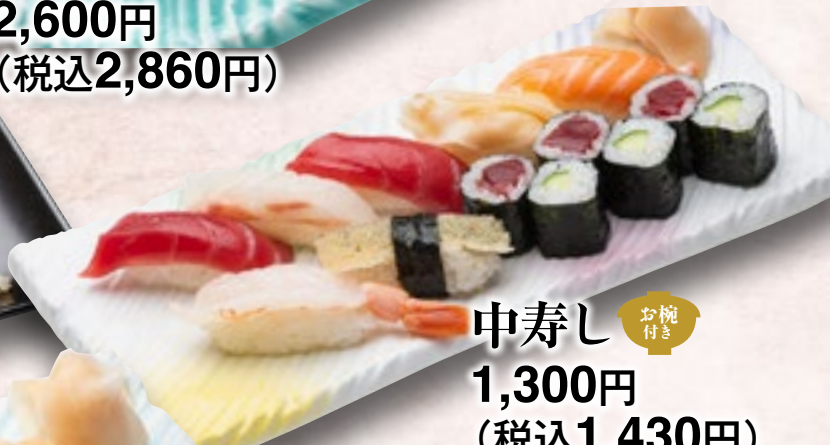
中寿司 お椀付き 1,300円 (税込1,430円)