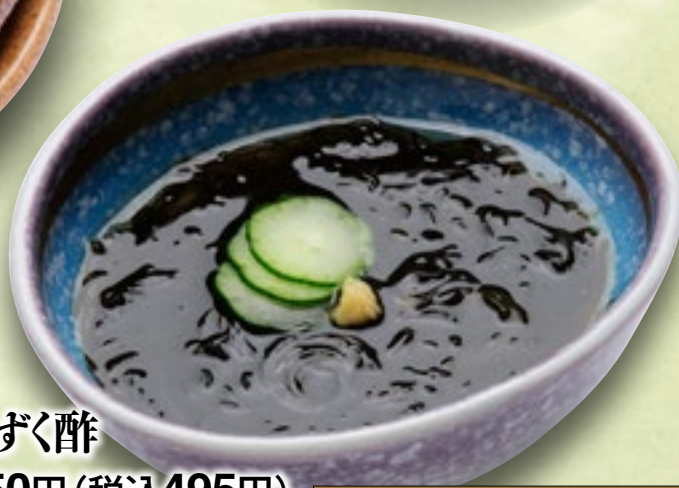
もずく酢 450円(税込495円)