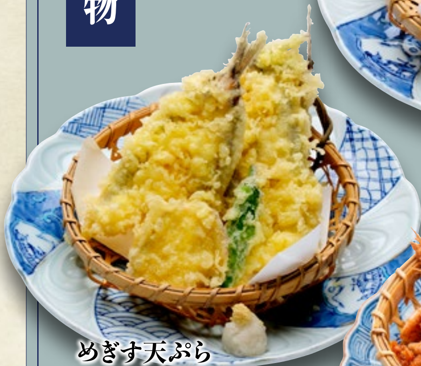
めぎす天ぷら 680円(税込748円)