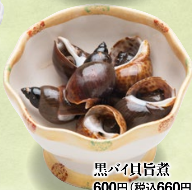
黒バイ貝旨煮 600円(税込660円)