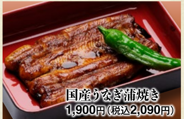
国産りなぎ蒲焼き 1,900円(税込2,090円)