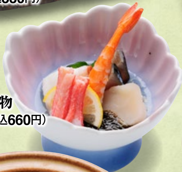
海鮮酢の物 600円(税込660円)