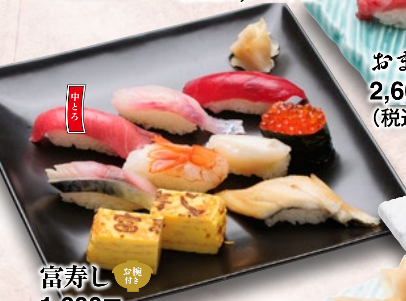
富寿司 お椀付き 1,600円 (税込1,760円)