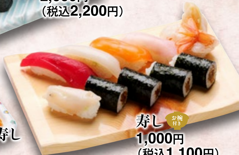
寿司 お椀付き 1,000円 (税込1,100円)