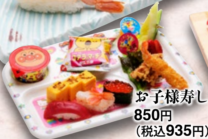
お子様寿司 850円 (税込935円)