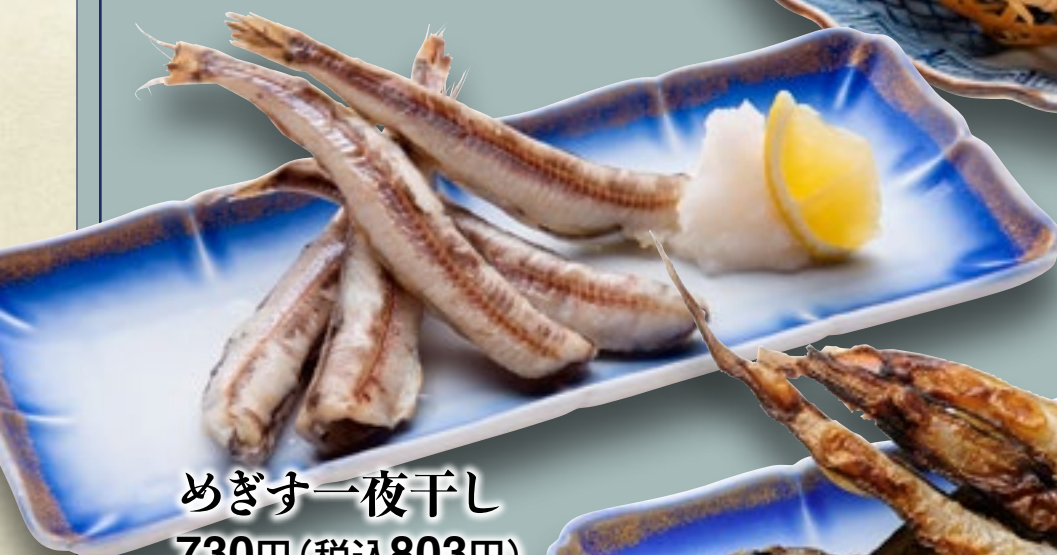
めぎす一夜干し 730円(税込803円)