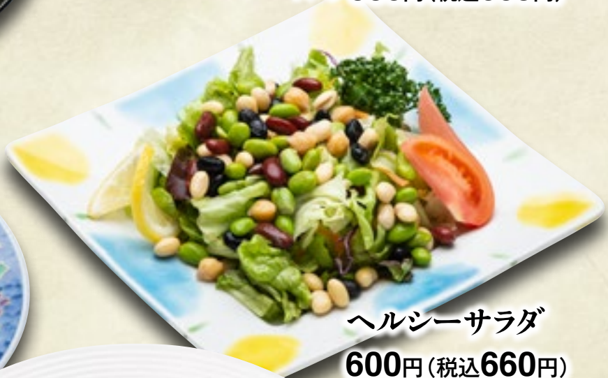
ヘルシーサラダ 600円(税込660円)