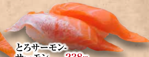
とろサーモン- サーモン 238円 Toro Salmon-Salmon Salmon & Fatty Salmon 三文魚&多脂三文魚