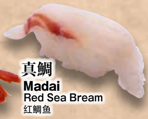
真鯛 Madai Red Sea Bream 红鯛鱼