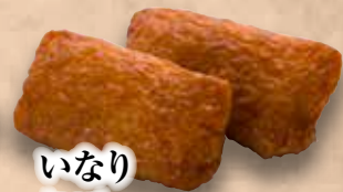
いなり Inari Deep-fried Beancurd 甜油豆腐皮