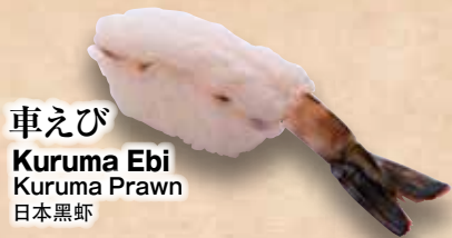
車えび Kuruma Ebi Kuruma Prawn 日本黑虾