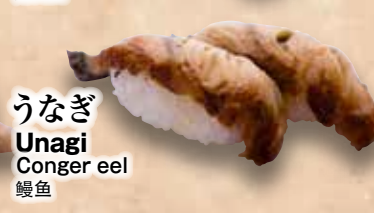
うなぎ Unagi Conger eel 鰻魚