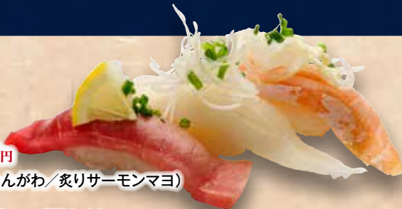
炙り三昧 488円 (炙り中とろ/炙りえんがわ/炙りサーモンマヨ) Aburi Zanmai Seared fishmeat Zanmai(3kinds) 火炙寿司三昧