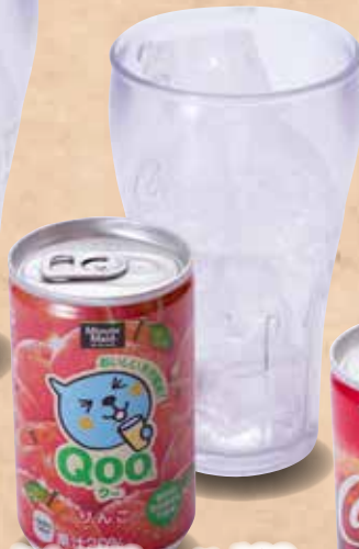
りんごジュース 160円