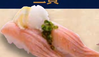
炙りサーモンポンズ 238円 Aburi Salmon Ponzu Seared Salmon Ponzu Sauce 炙橙醋三文鱼