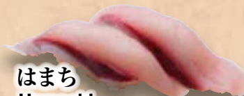
はまち Hamachi Yellowtail 黄尾魚