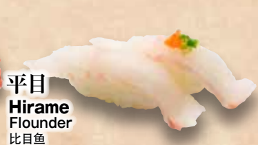
平目 Hirame Flounder 比目魚