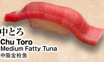
中とろ Chu Toro Medium Fatty Tuna 中脂金枪鱼