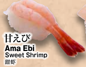
甘えび Ama Ebi Sweet Shrimp 甜虾