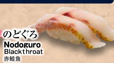
のどぐろ Nodoguro Blackthroat 赤鯮魚

※写真のメニューは入荷状況により商品が異なる場合がございます。※表示価格はすべて消費税別金額です。