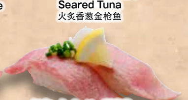
炙り大とろ 768円 Aburi Otoro Seared Fatty Tuna 炙多脂金枪鱼