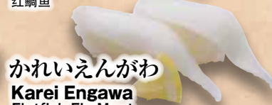
かれいえんがわ Karei Engawa Flatfish Fin Meat 鱈魚魚翅