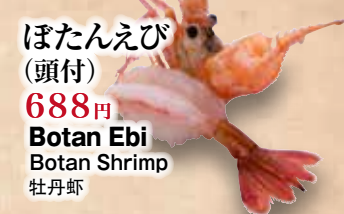
ぼたんえび (頭付) 688円 Botan Ebi Botan Shrimp 牡丹虾