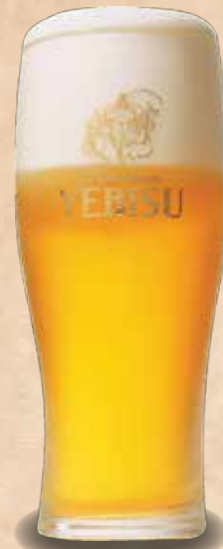
エビス生ビール 560円 YEBISU Nama Beer Beer 啤酒