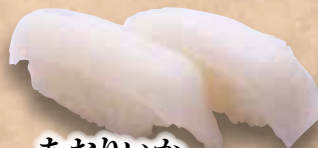
あおりいか Aori Ika Bigfin Leef Squid 漳泥乌贼