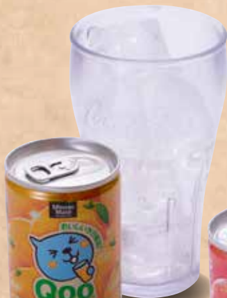
オレンジジュース

みかん/ぶどう/マスカット Purun Purun Qoo Jelly(Tangerine)/Jelly(Grape)/Jelly(Masta) 橘子味果冻/葡萄味果冻/白葡萄味果冻