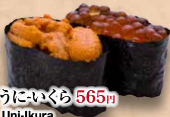
うに-いくら 565円 Uni-Ikura Sea Urchin & Salmon roe 海胆&三文鱼子