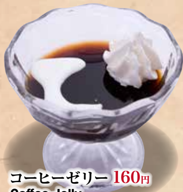
コーヒーゼリー 160円

360円 Panna Cotta Blueberry Blueberry Panna Cotta 蓝莓味意式奶冻