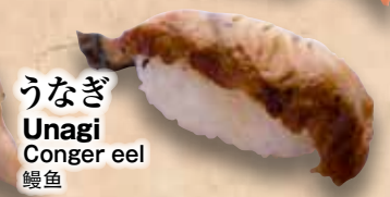
うなぎ Unagi Conger eel 鰻鱼