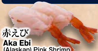
赤えび Aka Ebi (Alaskan) Pink Shrimp 紅蝦