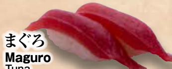
まぐろ Maguro Tuna 金枪魚