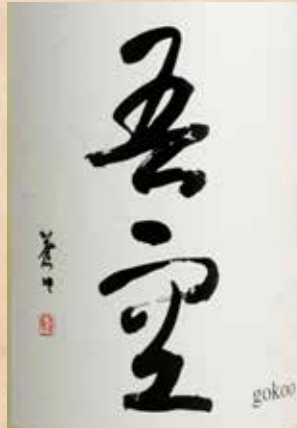
麦焼酎 吾空 480円 Mugi Shochu Goku Mugi Shochu Goku 小麦烧酒 吾空