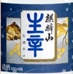
麒麟山 生辛 300ml 860円 Kirinzan Namakara Kirinzan Namakara(Sake) 300ml 麒麟山 生辛(日本酒) 300ml