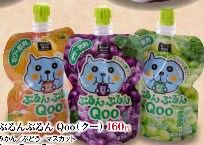
ふるんふるん Qoo(クー) 160円

みかん/ぶどう/マスカット Purun Purun Qoo Jelly(Tangerine)/Jelly(Grape)/Jelly(Masta) 橘子味果冻/葡萄味果冻/白葡萄味果冻