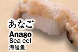
あなご Anago Sea eel 海鳗鱼