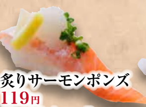
炙りサーモンポンズ 119円 Aburi Salmon Ponzu Seared Salmon Ponzu Sauce 炙橙醋三文鱼