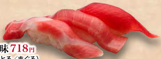
まぐろ三昧 718円 (大とろ/中とろ/まぐろ) Maguro Zanmai Tuna Zanmai (3kinds) 金槍魚三昧