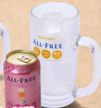
オールフリー コラーゲン 360円 All-Free Collagen Non-alcoholic Collagen sour 无酒精胶原蛋白鸡尾酒