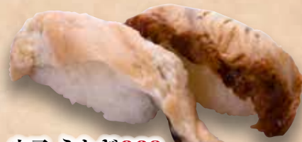
穴子-うなぎ 368円 Anago-Unagi Sea eel & Conger eel 海鰻魚&鰻魚