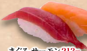
まぐろ-サーモン 213円 Maguro-Salmon Tuna & Salmon 金槍魚&三文魚