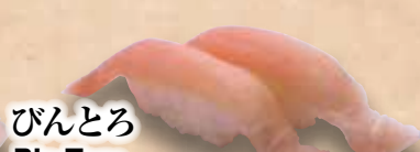
びんころ Bin Toro Albacore Tuna Belly 长鳍金枪鱼肚腩