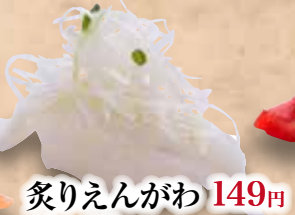
炙りえんがわ 149円 Aburi Engawa Seared Fin Meat 炙鱼翅