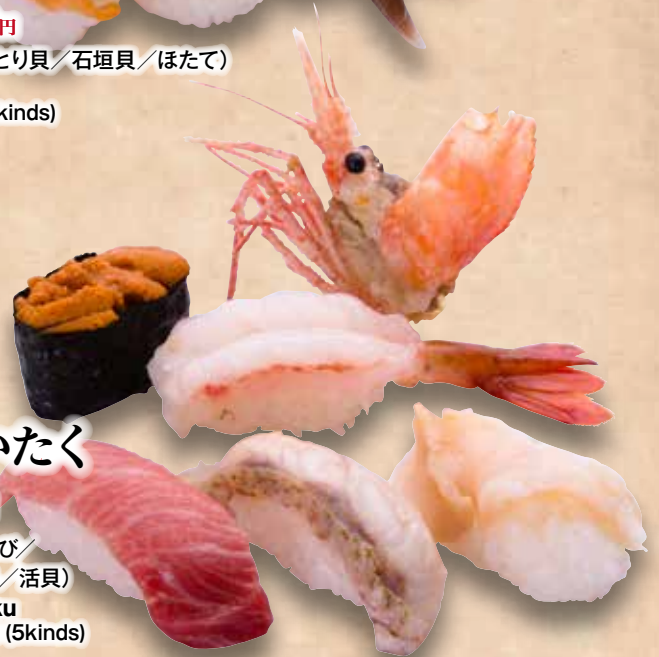
正にぜいたく 1,688円 (うに/ほたんえび/大とろ/のどぐろ/活貝) Masani Zeitaku Deluxe Zanmai (5kinds) 豪华三味(5种)