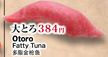
大とろ 384円 Otoro Fatty Tuna 多脂金枪鱼