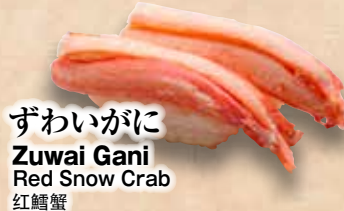
ずわいがに Zuwai Gani Red Snow Crab 紅鱈蟹