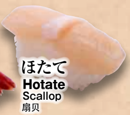
ほたて Hotate Scallop 扇贝