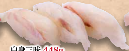
白身三昧 448円 (平目/本日の白身/真鯛) Shiromi Zanmai White fishmeat Zanmai 白身魚三昧