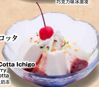
パナコッタ いちご

360円 Panna Cotta Ichigo Strawberry Panna Cotta 草莓味意式奶冻