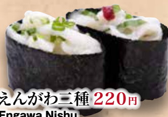
えんがわ三種 220円 Engawa Nishu Flounder Fin (2kinds) 鱼翅2种