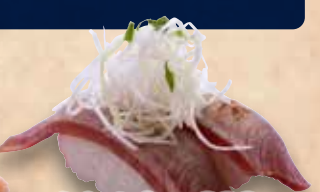
炙りまぐろ 238円 Aburi Maguro Seared Tuna 炙香葱金枪鱼