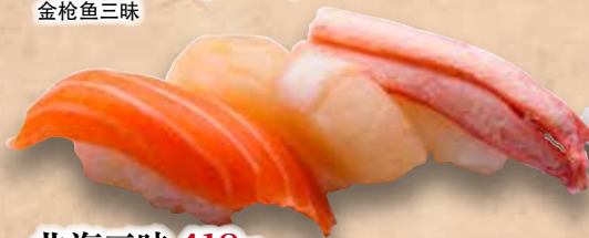
北海三昧 418円 (サーモン/ほたて/紅ずわい) Hokkai Zanmai Hokkai Zanmai (3kinds) 北海三昧