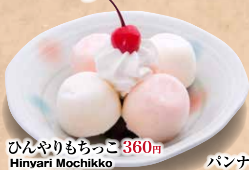
ひんやりもちっこ 360円