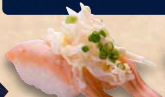
炙りサーモンマヨ 238円 Aburi Salmon Mayo Seared Salmon Mayonnaise 炙蛋黄酱三文鱼