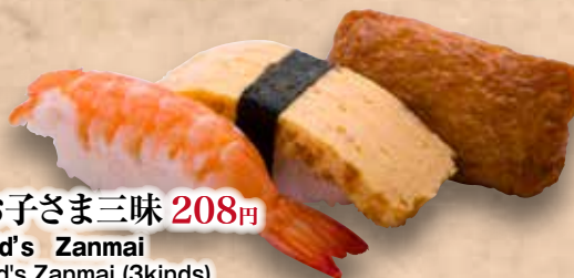
お子さま三昧 208円 Kid's Zanmai Kid's Zanmai (3kinds) 兒童三昧