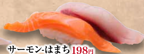
サーモン-はまち 198円 Salmon-Hamachi Salmon & Yellowtail 三文魚&黄尾魚