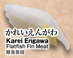
かれいえんがわ Karei Engawa Flatfish Fin Meat 鱈鱼鱼翅