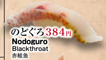
のどぐろ 384円 Nodoguro Blackthroat 赤鲑鱼