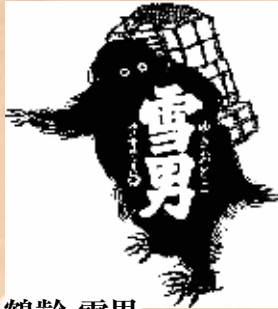
鶴齢 雪男 300ml 860円 Kakurei Yukiotoko Kakurei Yukiotoko(Sake) 300ml 鶴齢 雪男(日本酒) 300ml