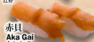
赤貝 Aka Gai Arkshell 赤貝