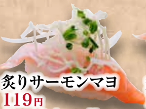
炙りサーモンマヨ 119円 Aburi Salmon Mayo Seared Salmon Mayonnaise 炙蛋黄酱三文鱼