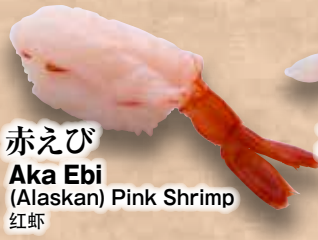
赤えび Aka Ebi (Alaskan) Pink Shrimp 红虾