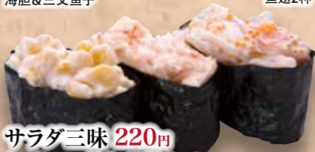
サラダ三味 220円 (コーンマヨ/花咲/海鮮) Sarada Zanmai Salad Zanmai 沙拉三味