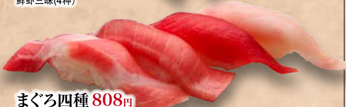
まぐろ四種 808円 (大とろ/中とろ/まぐろ/びんとろ) Maguro Yonshu Tuna Zanmai (4kinds) 金枪鱼三味(4种)