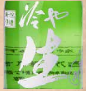
吉乃川 生 300ml 760円 Yoshinogawa Nama Yoshinogawa Nama (Sake) 300ml 吉乃川 生(日本酒) 300ml