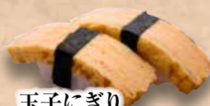
玉子にぎり Tamago Nigiri Japanese Omelette 日式煎蛋