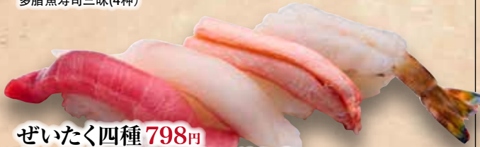
ぜいたく四種 798円 (中とろ/本日の白身/紅ずわい/車えび) Zeitaku Yonshu Deluxe Zanmai (4kinds) 豪华三味(4种)