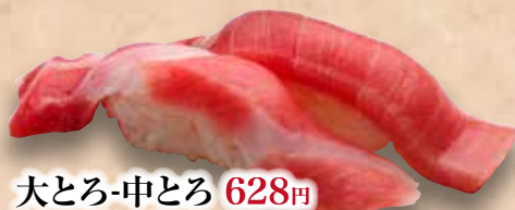
大とろ-中とろ 628円 Otoro-Chu Toro Fatty Tuna & Medium Fatty Tuna 多脂金槍魚&中脂金槍魚