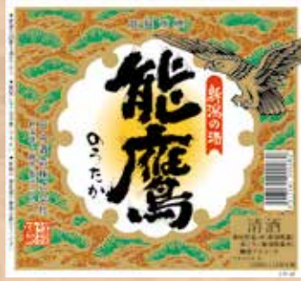
能鷹 徳利(冷/燗) 各 360円 Notaka Tokuri Notaka Tokuri(Sake) 能鷹 徳利(日本酒)