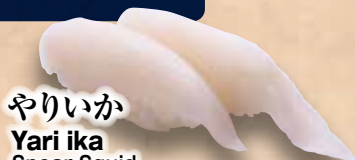
やりいか Yari Ika Spear Squid 长枪鱿鱼