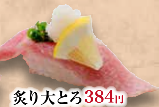
炙り大とろ 384円 Aburi Otoro Seared Fatty Tuna 炙多脂金枪鱼