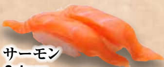
サーモン Salmon Salmon 三文魚