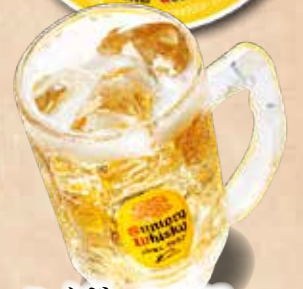
ハイボール 360円 Highball Highball Whisky 苏打水威士忌 (由威士忌和苏打水配制的酒精饮品)