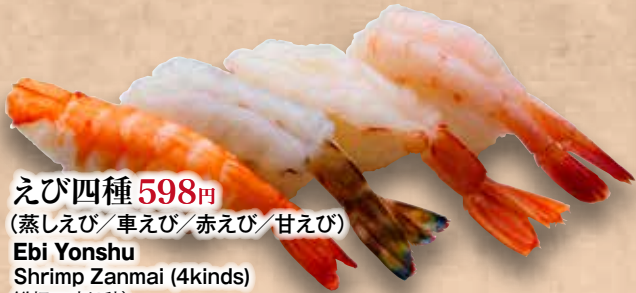
えび四種 598円 (蒸しえび/車えび/赤えび/甘えび) Ebi Yonshu Shrimp Zanmai (4kinds) 鲜虾三味(4种)