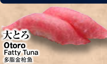
大とろ Otoro Fatty Tuna 多脂金枪魚