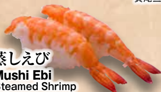
蒸しえび Mushi Ebi Steamed Shrimp 熟虾