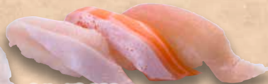
とろ三昧 398円 (ぶりとろ/とろサーモン/びんとろ) Toro Zanmai Fatty fishmeat Zanmai 多脂魚寿司三昧(3種)