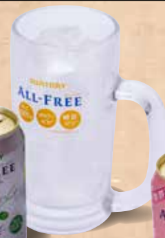
オールフリー ライムショット 360円 All-Free Lime Shot Non-alcoholic Lime sour 无酒精青柠鸡尾酒