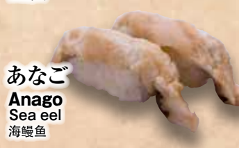
あなご Anago Sea eel 海鰻魚