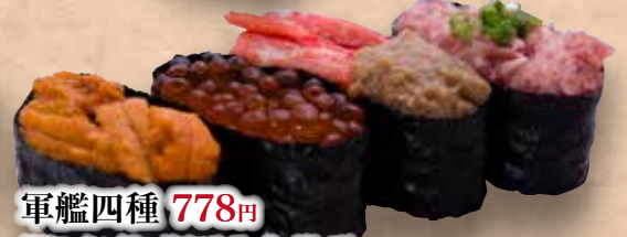
軍艦四種 778円 (うに/いくら/かにみそ/ねぎとろ) Gunkan Yonshu Gunkan Zanmai (4kinds) 军舰寿司三味(4种)

※写真のメニューは入荷状況により商品が異なる場合がございます。※表示価格はすべて消費税別金額です。