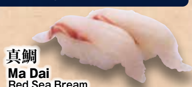
真鯛 Ma Dai Red Sea Bream 紅鯛魚