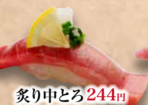
炙り中とろ 244円 Aburi Chu Toro Seared Medium Fatty Tuna 炙中脂金枪鱼