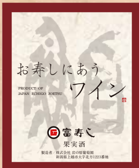
富寿しオリジナル お寿しにあう ワイン(赤/白) 各 1,300円 Osushi Ni Au Wine Red Wine White Wine 红葡萄酒 白葡萄酒