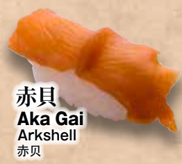
赤貝 Aka Gai Arkshell 赤贝