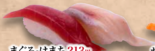
まぐろ-はまち 213円 Maguro-Hamachi Tuna & Yellowtail 黄尾魚&金槍魚