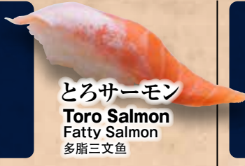
とろサーモン Toro Salmon Fatty Salmon 多脂三文鱼