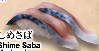
しめさば Shime Saba Mackerel 青花魚