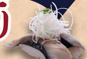
炙りさば 220円 Aburi Saba Seared Mackerel 炙青花鱼