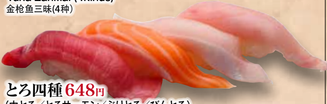
とろ四種 648円 (中とろ/とろサーモン/ぶりとろ/びんとろ) Toro Yonshu Fatty fishmeat Zanmai (4kinds) 多脂魚寿司三味(4种)