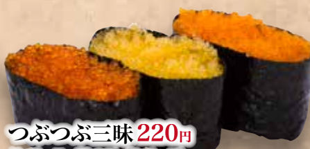
つぶつぶ三味 220円 (とびっこ/数の子/えびっこ) Tubu Tubu Zanmai Fish roe Zanmai 鱼子三味