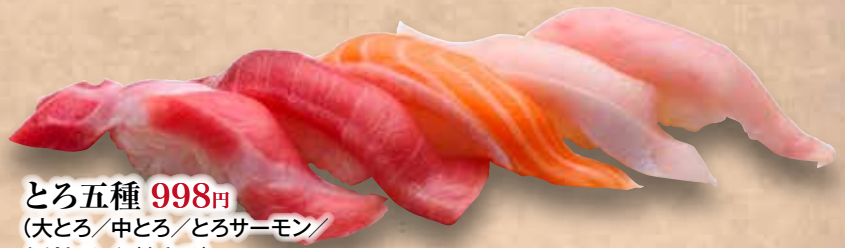
とろ五種 998円 (大とろ/中とろ/とろサーモン/ぶりとろ/びんとろ) Toro Goshu Fatty fishmeat Zanmai (5kinds) 多脂魚寿司三味(5种)