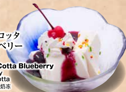
パナコッタ ブルーベリー

360円 Panna Cotta Ichigo Strawberry Panna Cotta 草莓味意式奶冻