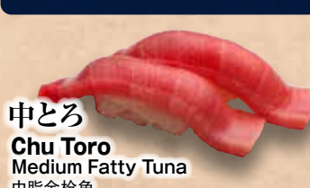
中とろ Chu Toro Medium Fatty Tuna 中脂金枪魚