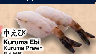
車えび Kuruma Ebi Kuruma Prawn 日本黑蝦