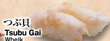
つぶ貝 Tsubu Gai Whelk 海螺