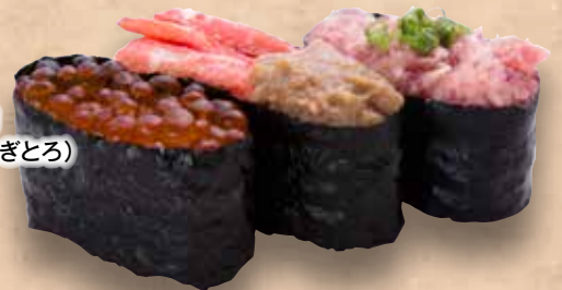
軍艦三味 398円 (いくら/かにみそ/ねぎとろ) Gunkan Zanmai Gunkan Zanmai 军舰寿司三味