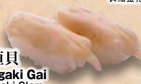
石垣貝 Ishigaki Gai Ishigaki Clam 石垣貝