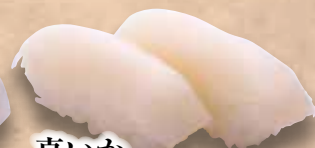
真いか Ma Ika Flying Squid 鱿鱼