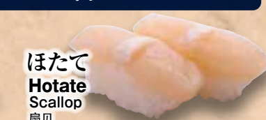
ほたて Hotate Scallop 扇貝