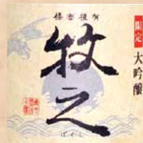
鶴齢 大吟醸 牧之 180ml 1,680円 Kakurei Bokushi Bokushi Daiginjyo (Sake) 180ml 鶴齢 大吟醸 牧之(日本酒) 180ml