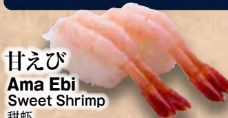
甘えび Ama Ebi Sweet Shrimp 甜蝦