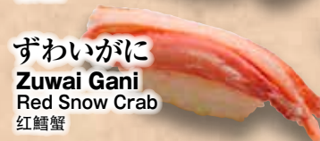
ずわいがに Zuwai Gani Red Snow Crab 红鱈蟹