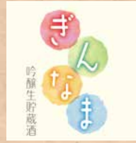
能鷹 ぎんなま 300ml 860円 Notaka Ginnama Notaka Nama(Sake) 300ml 能鷹 生(日本酒) 300ml