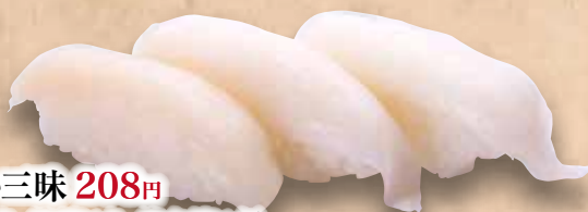
いか三昧 208円 (真いか/やりにか/あおりいか) Ika Zanmai Squid Zanmai (3kinds) 魷魚三昧