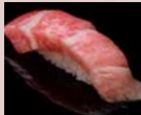
大とろ Fatty Tuna 多脂金枪鱼肚腩