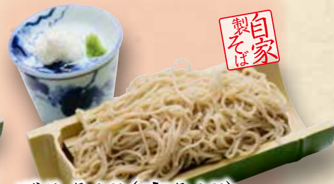
ざるそば(富そば) Zarusoba (Tomisoba)

Tomi Buckwheat Noodles & Tempura Set ¥1,280 荞麦面天妇罗套餐 1,280円