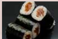
かんぴょう巻 150円 Dried Gourd Roll 腌葫芦卷