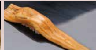
穴子一本 Sea eel (whole pc) 海鰻魚(整条)