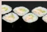
穴きゅう巻 400円 Sea eel & Cucumber Roll 海鰻鱼黄瓜卷