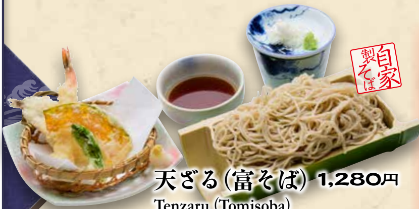
天ざる(富そば) 1,280円 Tenzaru (Tomisoba)

Tomi Buckwheat Noodles & Tempura Set ¥1,280 荞麦面天妇罗套餐 1,280円