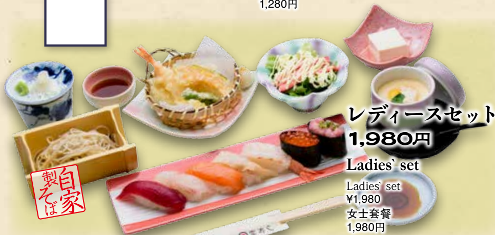
レディースセット 1,980円

650円 Tomi Buckwheat Noodles ¥650 自家制荞麦面 650円