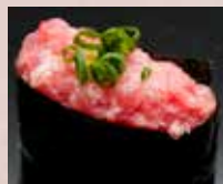
ねぎとろ Minced Tuna Belly with Spring Onion 香葱金枪鱼肚腩