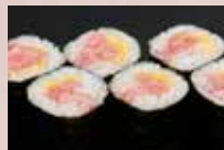
とろたく巻 400円 Minced Tuna & Pickles Roll 金枪鱼肚腩腌葫芦卷