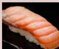
炙りサーモン Seared Salmon 火炙三文鱼