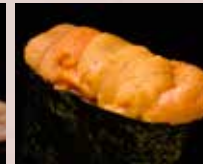
うに Sea Urchin 海胆