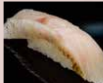
のどぐろ Blackthroat 赤鲑鱼