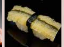
子持ち昆布 Herring roe & Kelp 鲱鱼子海带