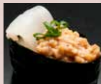
いか納豆 Squid & Natto Roll 鱿鱼纳豆卷