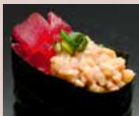
まぐろ納豆 Tuna & Natto 金枪鱼 纳豆