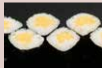
お新香巻 150円 Japanese Pickles Roll 腌萝卜卷