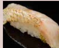
炙りのどぐろ Seared Blackthroat 火炙赤鲑鱼