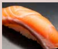
サーモン Salmon 三文鱼