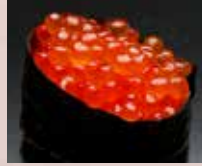
いくら Salmon Roe 三文魚子