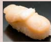
ほたて貝 Scallop 扇贝