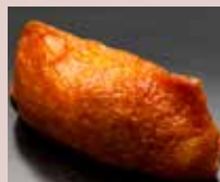
いなり Sweet Beancurd 甜油豆腐皮