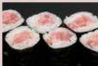
ねぎとろ巻 400円 Minced Tuna Belly Roll with Spring Onion 香葱金枪鱼肚腩卷