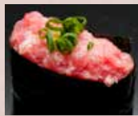
ねぎとろ Minced Tuna Belly with Spring Onion 香葱金枪鱼肚腩