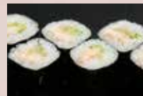
穴きゅう巻 400円 Sea eel & Cucumber Roll 海鰻鱼黄瓜卷