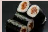
かんぴょう巻 150円 Dried Gourd Roll 腌葫芦卷