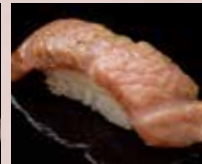
炙り大とろ Seared Fatty Tuna 火炙多脂金枪鱼肚腩