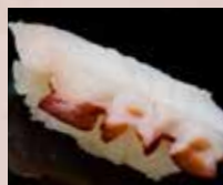
たこ Octopus 章鱼