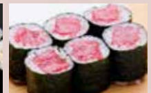
とろ鉄火 950円 Fatty Tuna Roll 多脂金枪鱼肚腩卷

※季節により料理内容が変わる場合もございます。 ※表示価格はすべて消費税別の金額です。 Some of the item subject to change or not available due to seasonal or stock availability. All prices are not inclusive of tax. 有些项目会因不是该季节产品或无货存有所更换。所有表示价格均未含税。