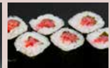
梅しそ巻 200円 Plum Roll 咸梅干紫苏卷