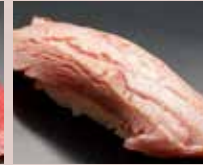
炙りとろ Seared Tuna Belly 火炙金枪鱼肚腩