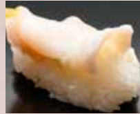
活ばい貝 Ivoryshell 日本凤螺