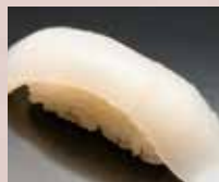
真いか Flying Squid 鱿鱼