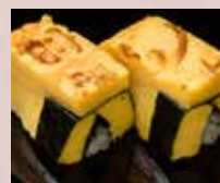
玉子 Thick Sliced Omelet 厚烧日式煎蛋