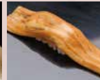
穴子一本 Sea eel (whole pc) 海鰻魚(整条)