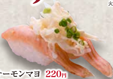
炙りサーモンマヨ 220円 Aburi Salmon Mayo Seared Salmon Mayonnaise 炙蛋黃醬三文魚