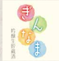
能鷹 ぎんなま 日本酒度 +5 300ml 840円 Notaka Ginnama Notaka Nama(Sake) 能鷹 生(日本酒)