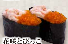
花咲とびっこ Hanasaki Tobikko Crab Stick Salad & Flying fish Roe 蟹棒飞鱼子沙拉