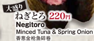
大盛り ねぎとろ 220円 Negitoro Minced Tuna & Spring Onion Roll 香葱金枪鱼碎卷