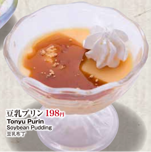
豆乳プリン 198円 Tonyu Purin Soybean Pudding 豆乳布丁