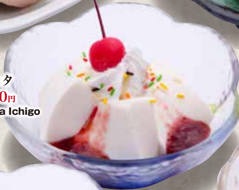
パナコッタ いちご 360円 Panna Cotta Ichigo Strawberry Panna Cotta 草莓味意式奶冻