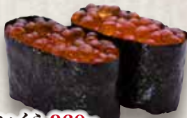
いくら 360円 Ikura Salmon Roe 三文鱼子