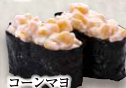
コーンマヨ Corn Mayo Corn & Mayonaise 玉米蛋黄酱