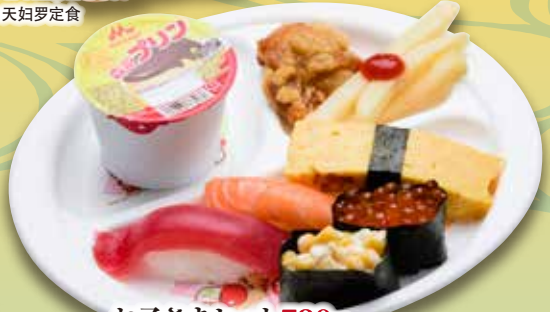
お子さまセット 720円

Nigiri Tempura Sushi & Tempura Set 寿司 & 天妇罗定食