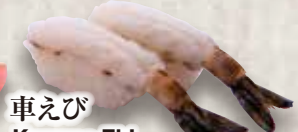
車えび Kuruma Ebi Kuruma Prawn 日本黑虾