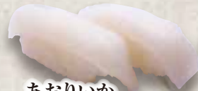
あおりいか Aori Ika Bigfin Leef Squid 漳泥乌贼