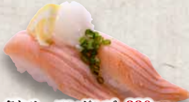
炙りサーモンポンズ 220円 Aburi Salmon Ponzu Seared Salmon Ponzu Sauce 炙橙醋三文魚