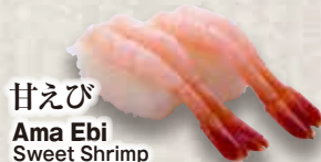
甘えび Ama Ebi Sweet Shrimp 甜虾