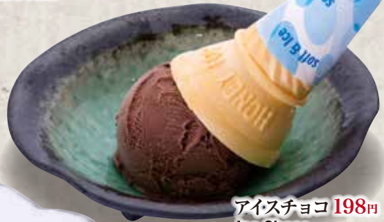
アイスチョコ 198円 Ice Choco Chocolate Icecream 巧克力味冰激凌