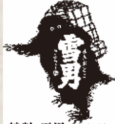
鶴齢 雪男 日本酒度 +7.5 300ml 840円 Kakurei Yukiotoko Kakurei Yukiotoko(Sake) 鶴齢 雪男(日本酒) 300ml