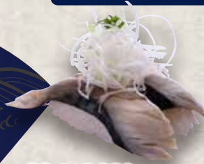
炙りさば 220円 Aburi Saba Seared Mackerel 炙青花魚