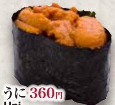
うに 360円 Uni Sea Urchin 海胆