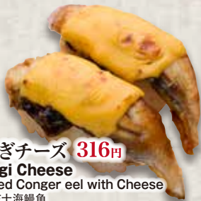
うなぎチーズ 316円 Unagi Cheese Seared Conger eel with Cheese 炙芝士海鰻魚