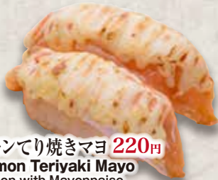
炙りサーモンてり焼きマヨ 220円 Aburi Salmon Teriyaki Mayo Grilled Salmon with Mayonnaise 照烧蛋黃醬三文魚