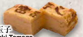
厚焼玉子 Atsuyaki Tamago Japanese Omelette (Large) 日式煎蛋(大)