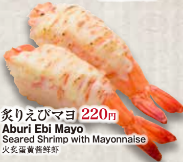
炙りえびマヨ 220円 Aburi Ebi Mayo Seared Shrimp with Mayonnaise 炙蛋黃醬鮮蝦