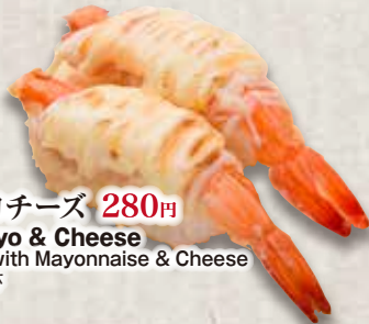
炙りえびマヨチーズ 280円 Aburi Ebi Mayo & Cheese Seared Shrimp with Mayonnaise & Cheese 炙芝士蛋黃醬鮮蝦