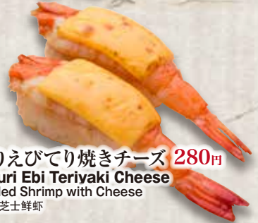
炙りえびてり焼きチーズ 280円 Aburi Ebi Teriyaki Cheese Grilled Shrimp with Cheese 照烧芝士鮮蝦