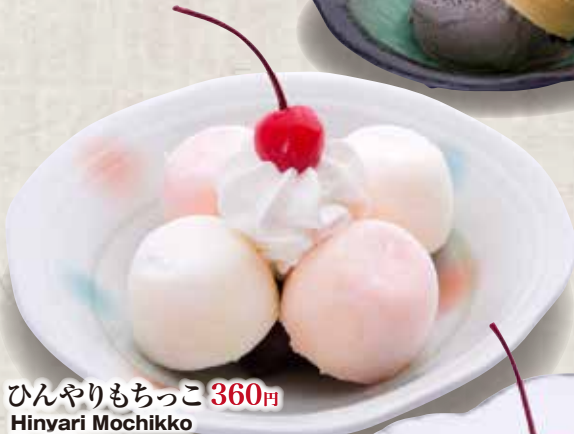
ひんやりもちっこ 360円 Hinyari Mochikko Mochi Icecream 日式冰激凌大福