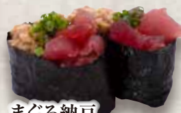
まぐろ納豆 Maguro Nattou Tuna & Natto 金枪鱼 纳豆