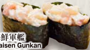
海鮮軍艦 Kaisen Gunkan Seafood Rolls 海鮮軍艦