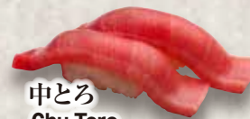
中とろ Chu Toro Medium Fatty Tuna 中脂金枪鱼