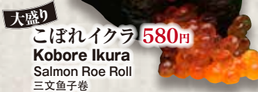
大盛り こぼれイクラ 580円 Kobore Ikura Salmon Roe Roll 三文鱼子卷