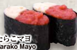
たらこマヨ Tarako Mayo Cod Roe & Mayonaise 鱈鱼子 蛋黄酱