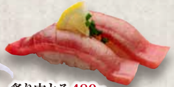
炙り中とろ 480円 Aburi Chu Toro Seared Medium Fatty Tuna 炙中脂金槍魚