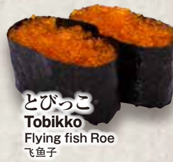
とびっこ Tobikko Flying fish Roe 飞鱼子