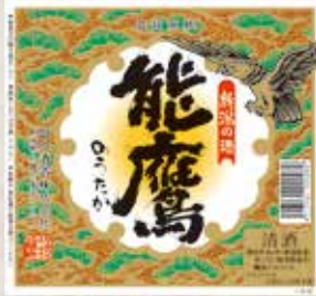
能鷹 徳利(冷/燗) 日本酒度 +6 各 360円 Notaka Tokuri Notaka Tokuri(Sake) 能鷹 徳利(日本酒)