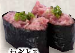
ねぎとろ Negi Toro Minced Tuna & Spring Onion Roll 香葱金枪鱼碎卷