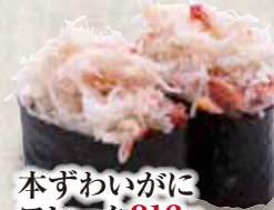
本ずわいがに フ레이크 316円 Hon Zuwai Gani Flake Snow Crab 鱈蟹