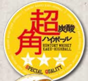
ハイボール 360円 Highball Highball Whisky 苏打水威士忌 (由威士忌和苏打水配制的酒精饮品)