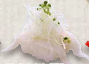
炙りえんがわ 280円 Aburi Engawa Seared Fin Meat 炙魚翅