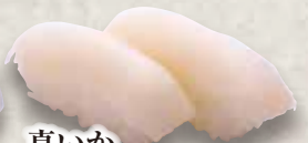
真いか Ma Ika Flying Squid 鱿鱼