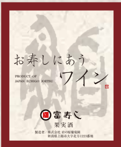
富寿しオリジナル お寿しにあうワインハーフ(赤/白) 各 1,560円 Osushi Ni Au Wine Red Wine 白葡萄酒 红葡萄酒 白葡萄酒