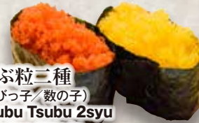
つぶ粒三種 (えびっ子/数の子) Tsubu Tsubu 2syu Fish Roe (2kinds) 鱼子卷(2种)