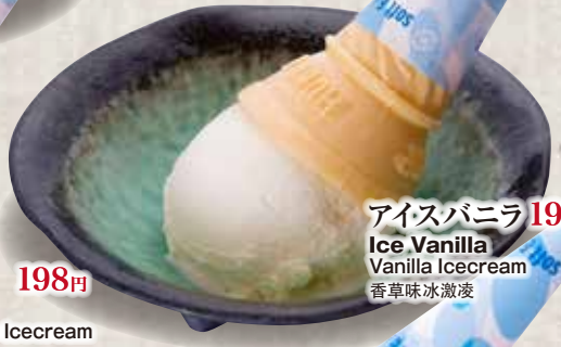
アイスバニラ 198円 Ice Vanilla Vanilla Icecream 香草味冰激凌