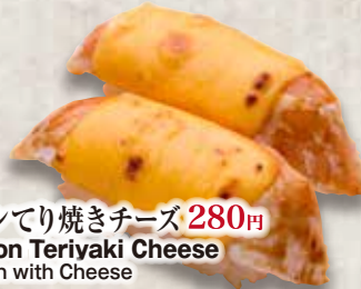
炙りサーモンてり焼きチーズ 280円 Aburi Salmon Teriyaki Cheese Grilled Salmon with Cheese 照烧芝士三文魚