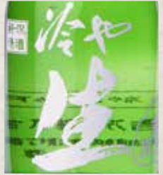
吉乃川 生 日本酒度 +3 300ml 720円 Yoshinogawa Nama Yoshinogawa Nama (Sake) 吉乃川 生(日本酒)