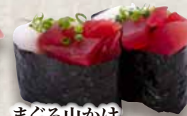
まぐろ山かけ Maguro Yamakake Tuna & Grated Yam 金枪鱼山药泥