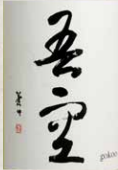
麦焼酎 吾空 480円 Mugi Shochu Goku Mugi Shochu Goku 小麦烧酒 吾空