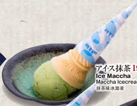
アイス抹茶 198円 Ice Maccha Maccha Icecream 抹茶味冰激凌