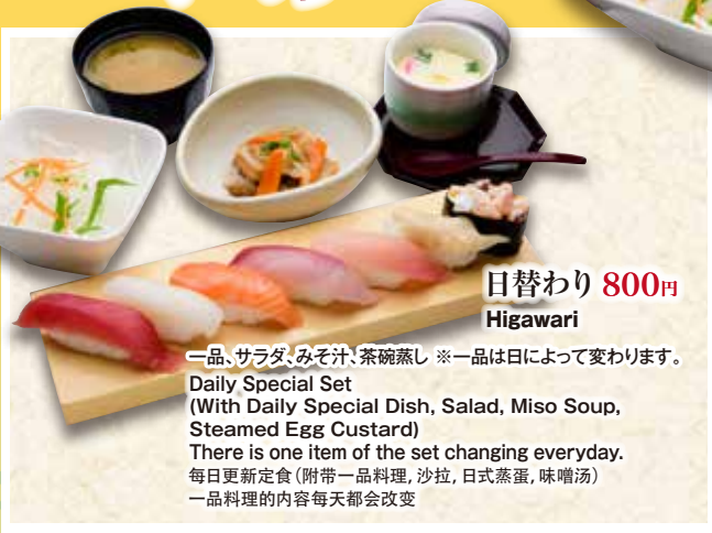
日替わり 800円 Higawari

一品、サラダ、みそ汁、茶碗蒸し ※一品は日によって変わります。 Daily Special Set (With Daily Special Dish, Salad, Miso Soup, Steamed Egg Custard) There is one item of the set changing everyday. 毎日更新定食(附带一品料理, 沙拉, 日式蒸蛋, 味噌汤) 一品料理的内容每天都会改变