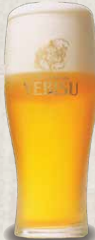
エビス生ビール 396円 YEBISU Nama Beer Beer 啤酒