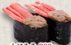
かにみそ 280円 Kani Miso Crab Meat & Crab Paste 蟹肉 蟹膏