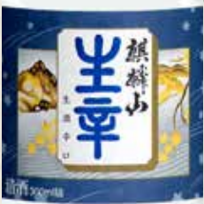
麒麟山 生辛 日本酒度 +6 300ml 840円 Kirinzan Namakara Kirinzan Namakara(Sake) 麒麟山 生辛(日本酒) 300ml