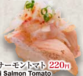
炙りサーモントマト 220円 Aburi Salmon Tomato Seared Salmon & Tomato 炙三文魚西红柿