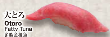
大とろ Otoro Fatty Tuna 多脂金枪鱼