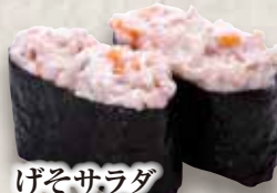
げそサラダ Geso Salad Squid Tentacles Salad 鱿鱼须沙拉