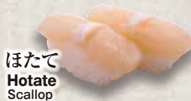
ほたて Hotate Scallop 扇贝