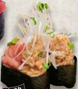
大盛り ねぎとろ納豆 Negitoro Natto Minced Tuna & Natto Roll 金枪鱼碎纳豆卷