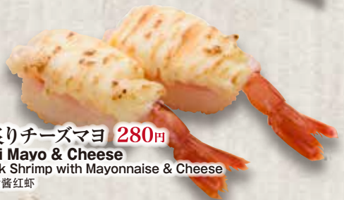
赤えび炙りチーズマヨ 280円 Aburi Ebi Mayo & Cheese Seared Pink Shrimp with Mayonnaise & Cheese 炙芝士蛋黃醬紅蝦