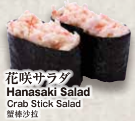
花咲サラダ Hanasaki Salad Crab Stick Salad 蟹棒沙拉