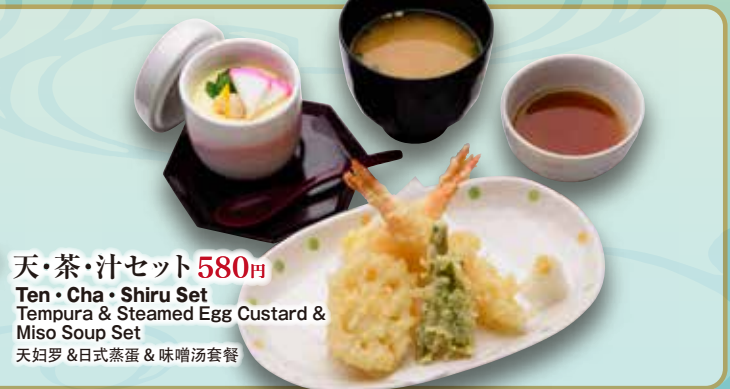
天・茶・汁セット 580円

Cha · Shiru Set Steamed Egg Custard & Miso Soup Set 日式蒸蛋 & 味噌汤套餐