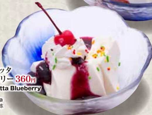
パナコッタ ブルーベリー 360円 Panna Cotta Blueberry Blueberry Panna Cotta 蓝莓味意式奶冻