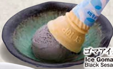
ゴマアイス 198円 Ice Goma Black Sesame Icecream 黑芝麻味冰激凌