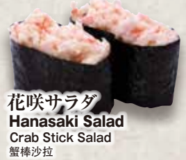
花咲サラダ Hanasaki Salad Crab Stick Salad 蟹棒沙拉