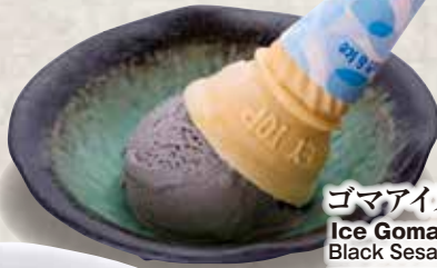
ゴマアイス 198円 Ice Goma Black Sesame Icecream 黑芝麻味冰激凌