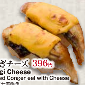
うなぎチーズ 396円 Unagi Cheese Seared Conger eel with Cheese 炙芝士海鰻魚