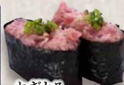
ねぎとろ Negi Toro Minced Tuna & Spring Onion Roll 香葱金枪鱼碎卷