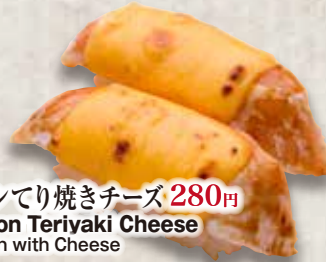
炙りサーモンてり焼きチーズ 280円 Aburi Salmon Teriyaki Cheese Grilled Salmon with Cheese 照烧芝士三文魚