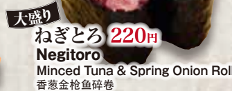
大盛り ねぎとろ 220円 Negitoro Minced Tuna & Spring Onion Roll 香葱金枪鱼碎卷