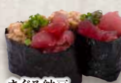
まぐろ納豆 Maguro Nattou Tuna & Natto 金枪鱼 纳豆