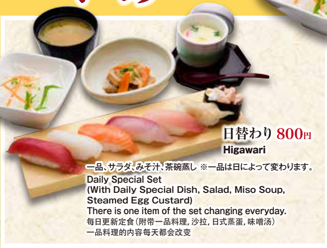
日替わり 800円 Higawari

一品、サラダ、みそ汁、茶碗蒸し ※一品は日によって変わります。 Daily Special Set (With Daily Special Dish, Salad, Miso Soup, Steamed Egg Custard) There is one item of the set changing everyday. 毎日更新定食(附带一品料理、沙拉、日式蒸蛋、味噌汤) 一品料理の内容每天都会改变