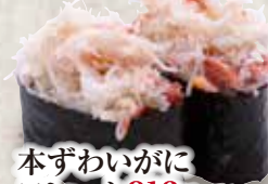
本ずわいがに フ레이크 316円 Hon Zuwai Gani Flake Snow Crab 鱈蟹