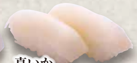
真いか Ma Ika Flying Squid 鱿鱼