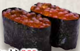
いくら 360円 Ikura Salmon Roe 三文鱼子