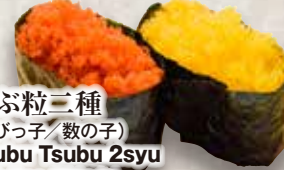
つぶ粒三種 (えびっ子/数の子) Tsubu Tsubu 2syu Fish Roe (2kinds) 鱼子卷(2种)