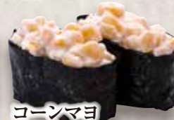
コーンマヨ Corn Mayo Corn & Mayonaise 玉米蛋黄酱