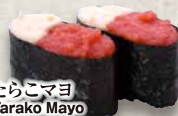
たらこマヨ Tarako Mayo Cod Roe & Mayonaise 鱈鱼子 蛋黄酱