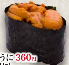
うに 360円 Uni Sea Urchin 海胆