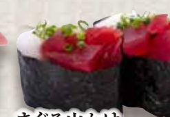
まぐろ山かけ Maguro Yamakake Tuna & Grated Yam 金枪鱼山药泥