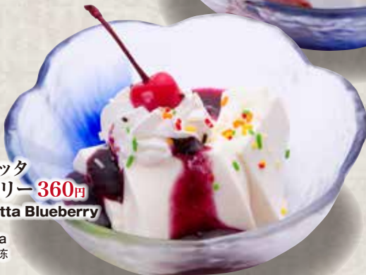
パナコッタ ブルーベリー 360円 Panna Cotta Blueberry Blueberry Panna Cotta 蓝莓味意式奶冻