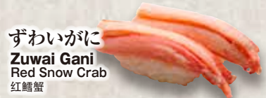
ずわいがに Zuwai Gani Red Snow Crab 红鳃蟹