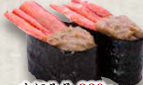
かにみそ 360円 Kani Miso Crab Meat & Crab Paste 蟹肉 蟹膏