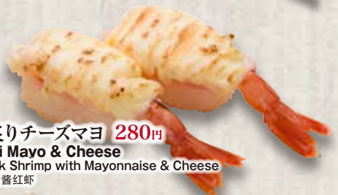
赤えび炙りチーズマヨ 280円 Aburi Ebi Mayo & Cheese Seared Pink Shrimp with Mayonnaise & Cheese 炙芝士蛋黃醬紅蝦