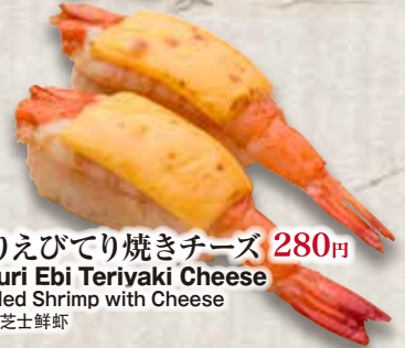
炙りえびてり焼きチーズ 280円 Aburi Ebi Teriyaki Cheese Grilled Shrimp with Cheese 照烧芝士鮮蝦