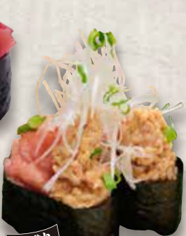
大盛り ねぎとろ納豆 Negitoro Natto Minced Tuna & Natto Roll 金枪鱼碎纳豆卷