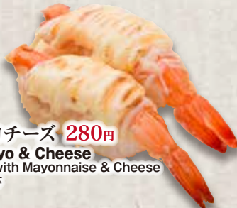
炙りえびマヨチーズ 280円 Aburi Ebi Mayo & Cheese Seared Shrimp with Mayonnaise & Cheese 炙芝士蛋黃醬鮮蝦