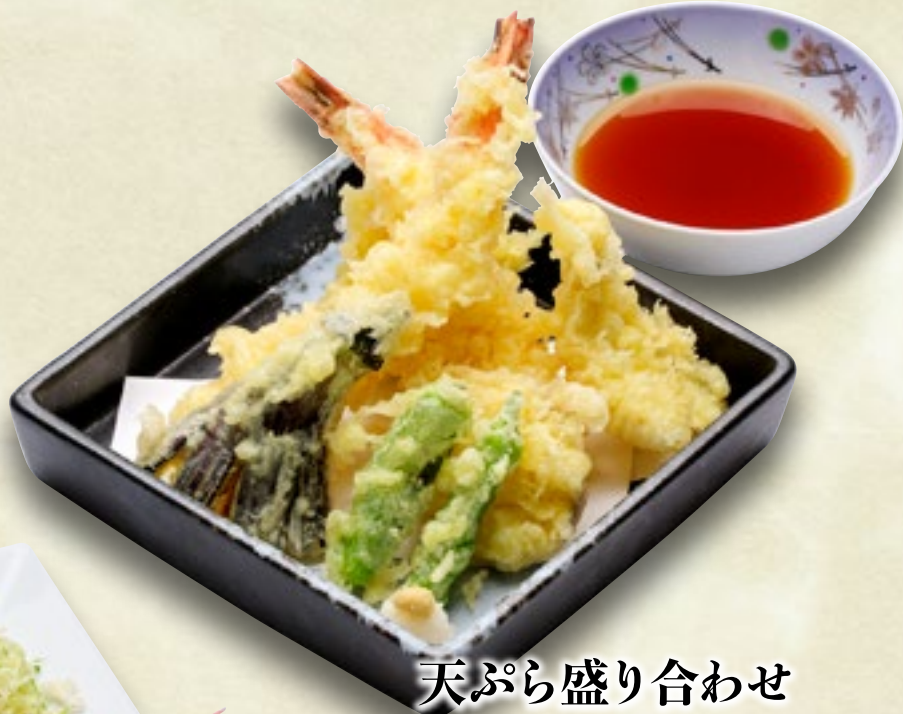
天ぷら盛り合わせ 1,000円(税込1,100円)