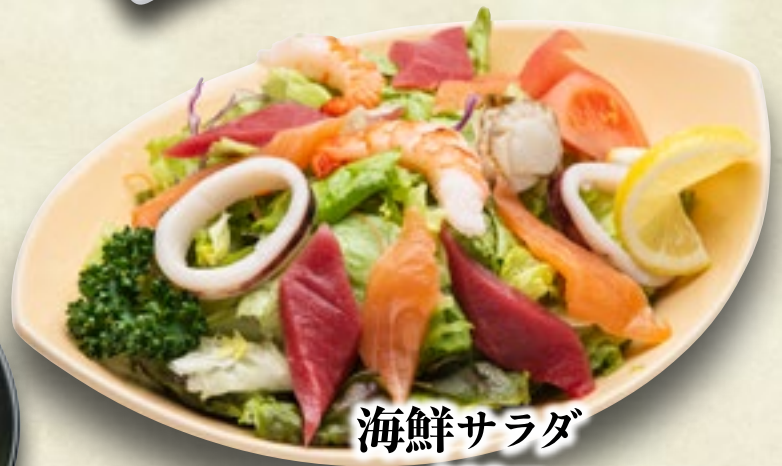
海鮮サラダ 980円(税込1,078円) ハーフ 630円(税込693円)