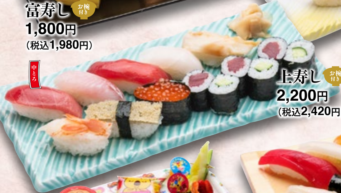
上寿し お椀付き 2,200円 (税込2,420円)