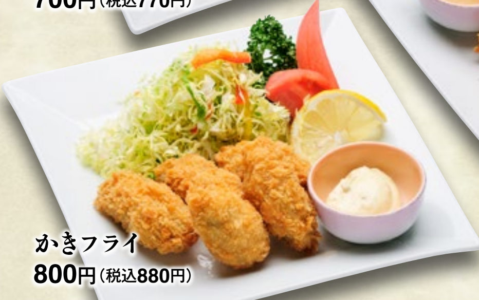
かきフライ 800円(税込880円)