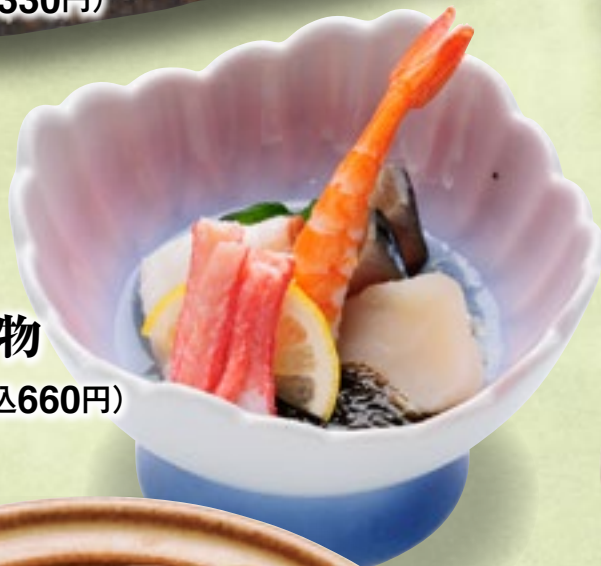
海鮮酢の物 600円(税込660円)