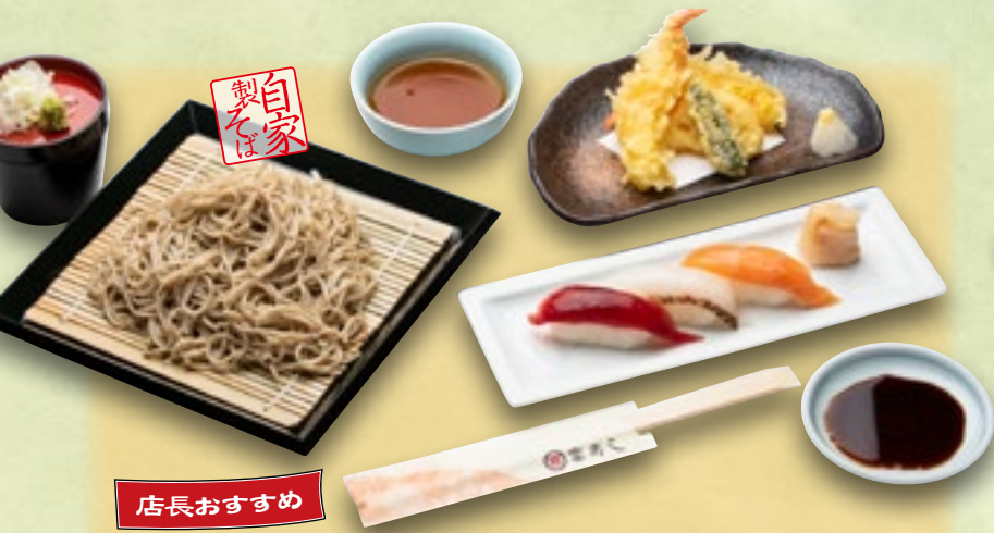
天ざる寿しセット 1,280円(税込1,408円)