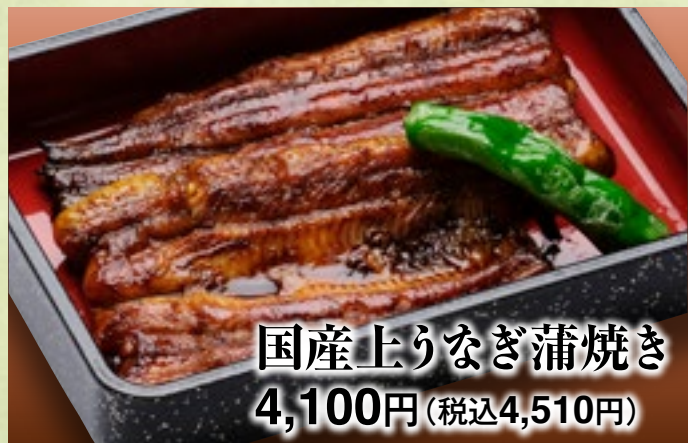
国産上りなぎ蒲焼き 4,100円(税込4,510円)