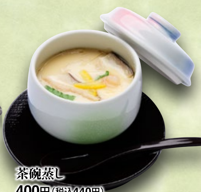
茶碗蒸し 400円(税込440円)