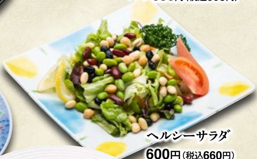
ヘルシーサラダ 600円(税込660円)