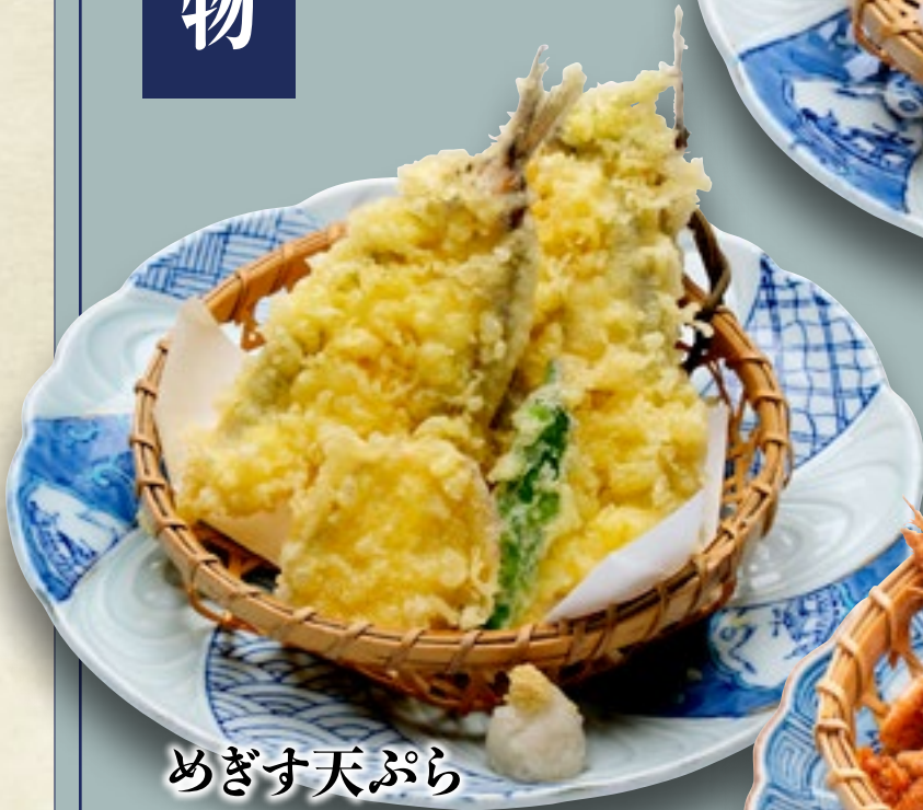
めぎす天ぷら 680円(税込748円)