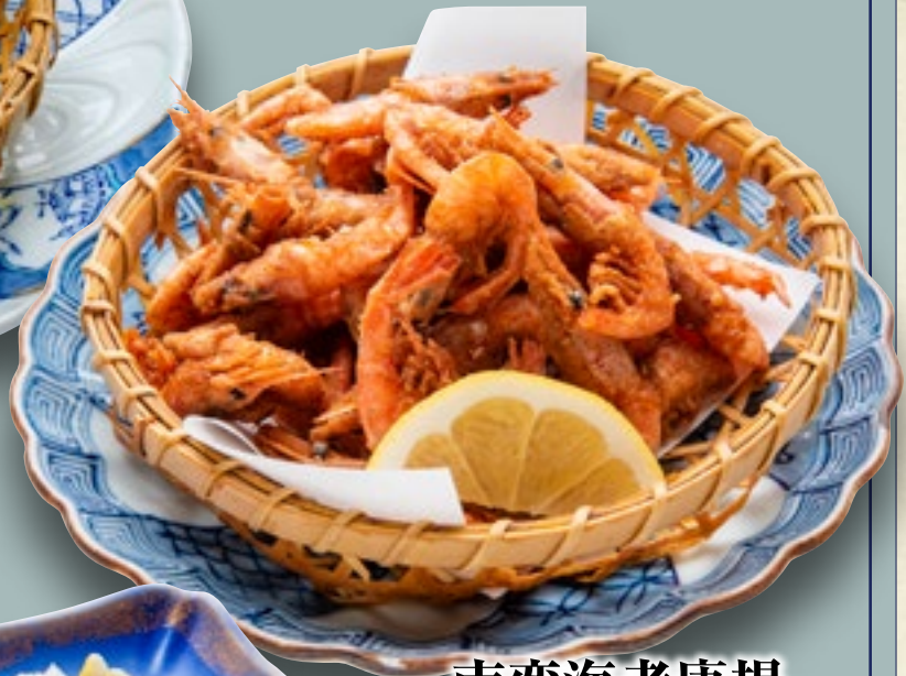
南蛮海老唐揚 700円(税込770円)