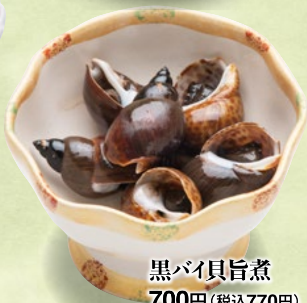
黒バイ貝旨煮 700円(税込770円)