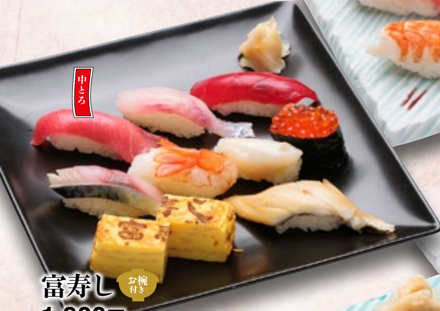
富寿し お椀付き 1,800円 (税込1,980円)