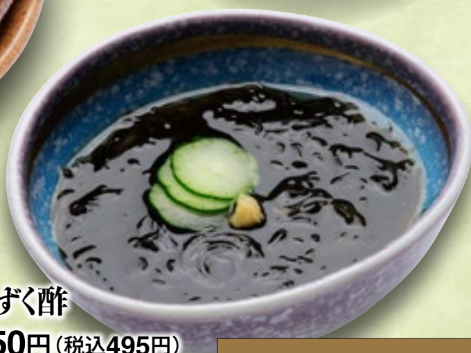
もずく酢 450円(税込495円)