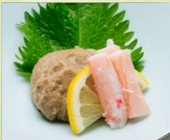
かに味噌つまみ 750円(税込825円)