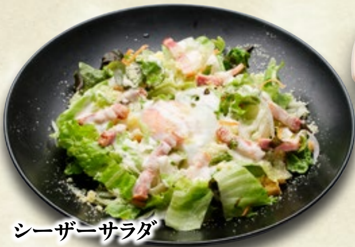
シーザーサラダ 600円(税込660円)