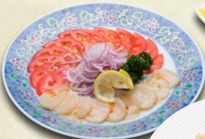
帆立とトマトのサラダ 800円(税込880円)