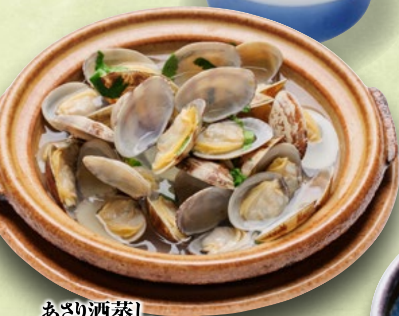
あさり酒蒸し 500円(税込550円)