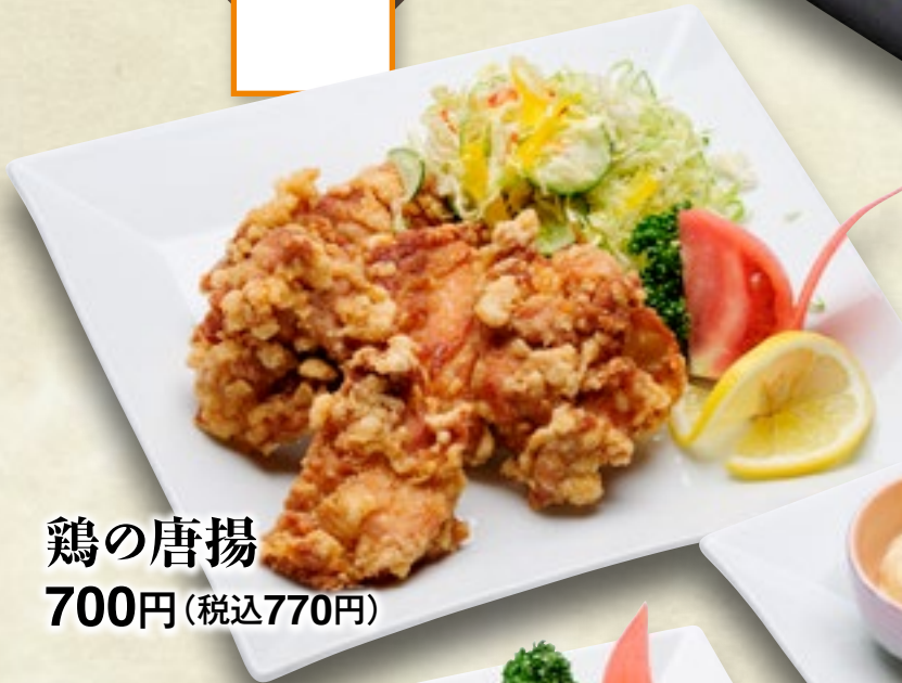
鶏の唐揚 700円(税込770円)