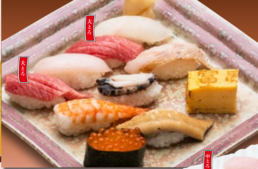
特上握り お椀付き 3,600円 (税込3,960円)