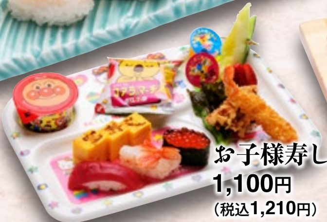
お子様寿し 1,100円 (税込1,210円)