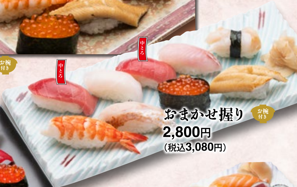
おまかせ握り お椀付き 2,800円 (税込3,080円)