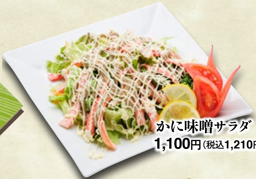
かに味噌サラダ 1,100円(税込1,210円)