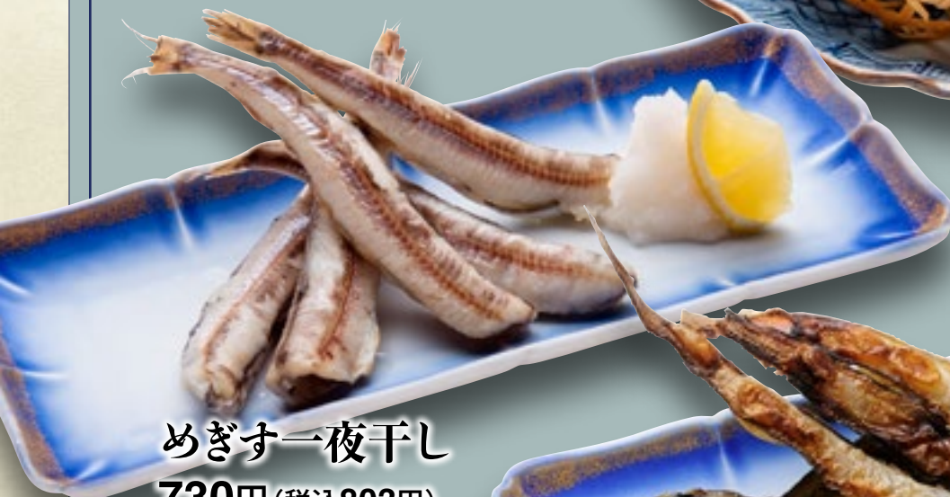
めぎす一夜干し 730円(税込803円)