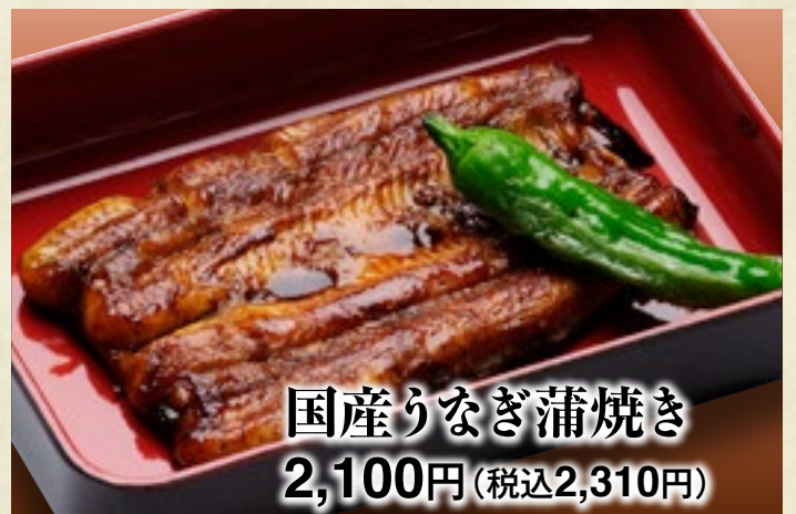
国産りなぎ蒲焼き 2,100円(税込2,310円)