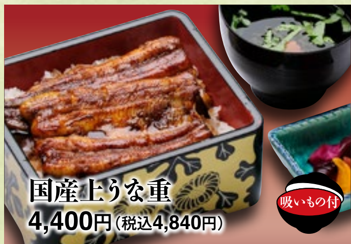
国産上りな重 4,400円(税込4,840円)