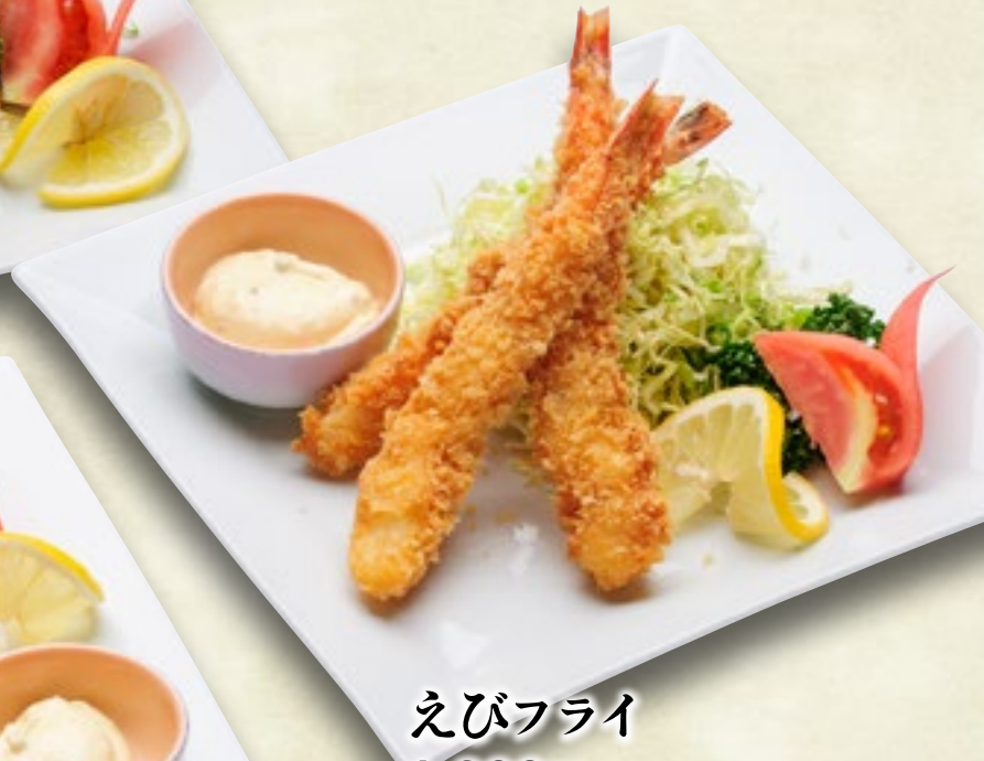
えびフライ 1,200円(税込1,320円)