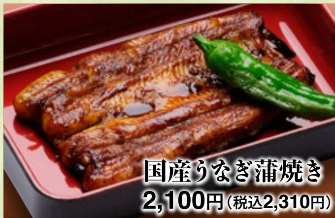
国産りなぎ蒲焼き 2,100円(税込2,310円)