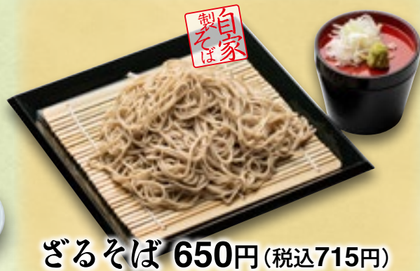
ざるそば 650円(税込715円)