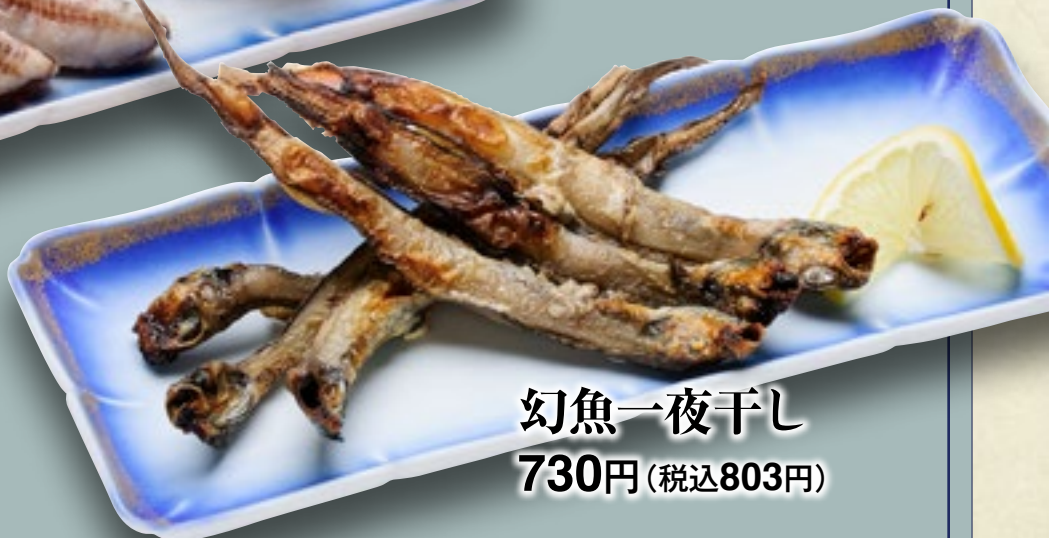
幻魚一夜干し 730円(税込803円)