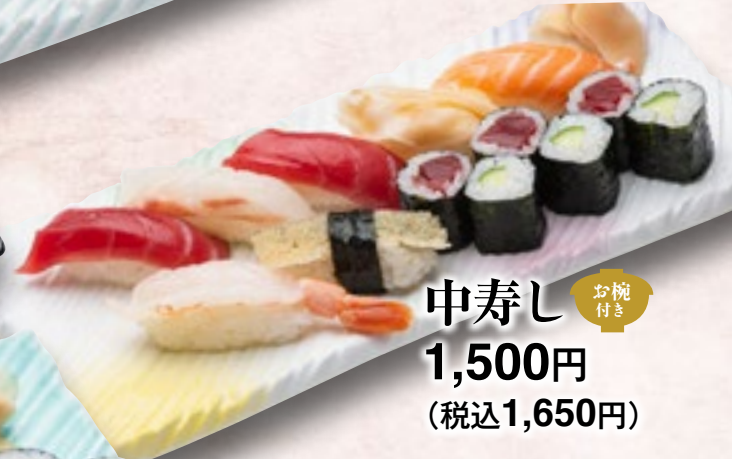
中寿し お椀付き 1,500円 (税込1,650円)