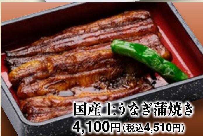
国産上りなぎ蒲焼き 4,100円(税込4,510円)