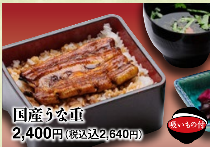
国産りな重 2,400円(税込2,640円)