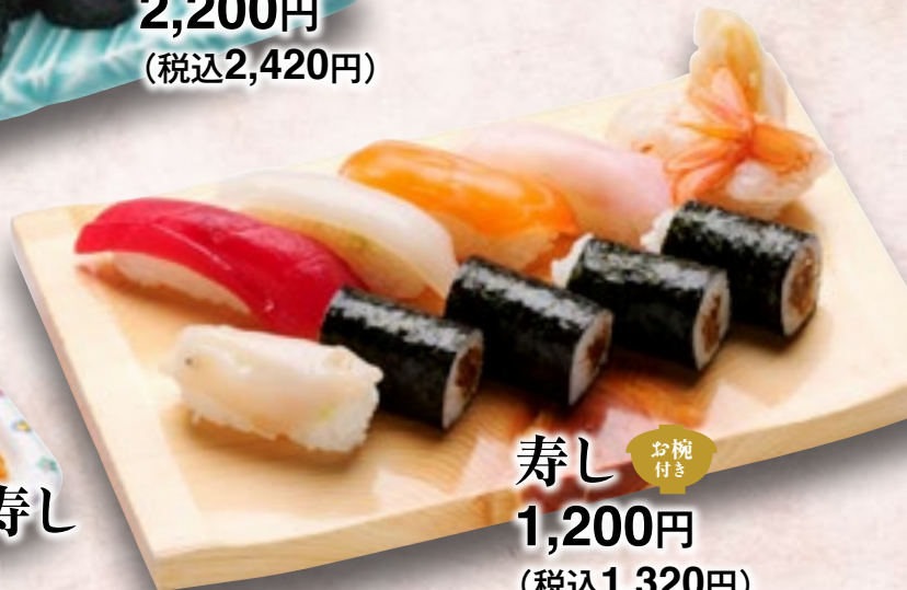
寿し お椀付き 1,200円 (税込1,320円)