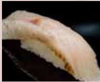
のどぐろ Blackthroat 赤鲑鱼