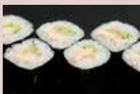
穴きゅう巻 400円 Sea eel & Cucumber Roll 海鳗鱼黄瓜卷