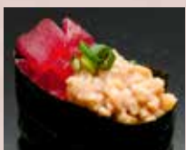
まぐろ納豆 Tuna & Natto 金枪鱼 纳豆