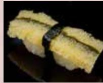
子持ち昆布 Herring roe & Kelp 鲱鱼子海带