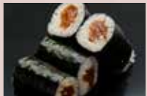
かんぴょう巻 150円 Dried Gourd Roll 腌葫芦卷