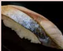
炙りしめさば Seared Mackerel 炙青花鱼