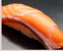
サーモン Salmon 三文鱼