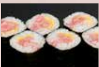
とろたく巻 400円 Minced Tuna & Pickles Roll 金枪鱼肚腩腌葫芦卷