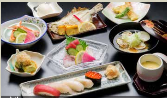
たけ 竹〈全9品〉 Kaiseki Course Take (9 items) Take Course (9 items) ¥4,000 竹 会席套餐 (全9品) 4,000円