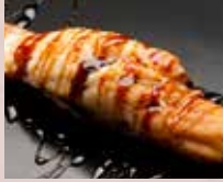
穴子 Sea Eel 海鳗鱼