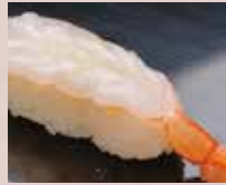
赤えび Red Shrimp 红虾