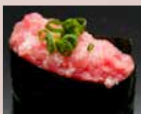
ねぎとろ Minced Tuna Belly with Spring Onion 香葱金枪鱼肚腩