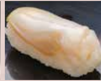
つぶ貝 Whelk 油螺