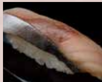
しめさば Mackerel 青花鱼