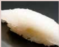
カレイえんがわ Halibut Fin Meat 鲽鱼鱼翅