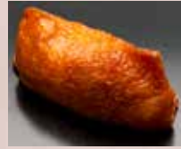
いなり Sweet Beancurd 甜油豆腐皮