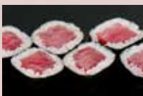
鉄火巻 400円 Tuna Roll 金枪鱼卷