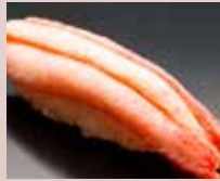
ずわいがに Snow Crab 雪蟹