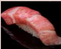
大とろ Fatty Tuna 多脂金枪鱼肚腩