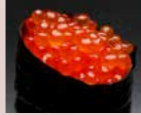
いくら Salmon Roe 三文鱼子