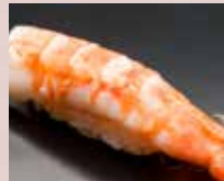
むしえび Steamed Shrimp 熟虾