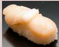
ほたて貝 Scallop 扇贝