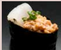
いか納豆 Squid & Natto Roll 鱿鱼纳豆卷