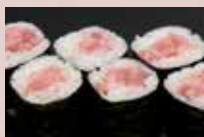
ねぎとろ巻 400円 Minced Tuna Belly Roll with Spring Onion 香葱金枪鱼肚腩卷