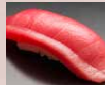
中とろ Medium Fatty Tuna 金枪鱼中脂肚腩