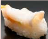
活ばい貝 Ivoryshell 日本凤螺