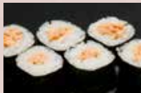
納豆巻 150円 Natto Roll 纳豆卷