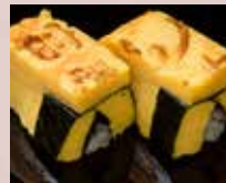
玉子 Thick Sliced Omelet 厚烧日式煎蛋