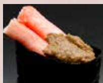
かにみそ Crab Meat & Brawn 蟹肉 蟹膏