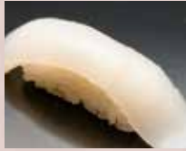
真いか Flying Squid 鱿鱼