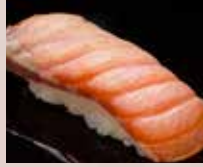
炙りサーモン Seared Salmon 炙三文鱼