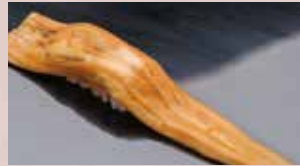
穴子一本 Sea eel (large) 海鳗鱼(大)