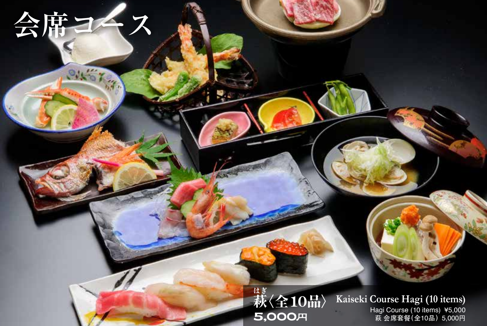
はぎ 萩〈全10品〉 Kaiseki Course Hagi (10 items) Hagi Course (10 items) ¥5,000 萩 会席套餐 (全10品) 5,000円