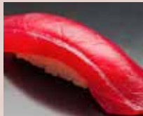
まぐろ Tuna 金枪鱼