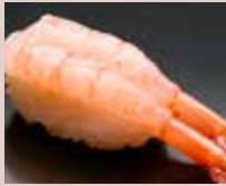
南蛮えび Sweet Shrimp 甜虾