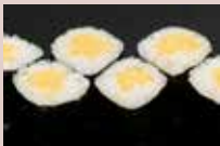
お新香巻 150円 Japanese Pickles Roll 腌萝卜卷