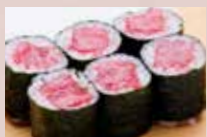
とろ鉄火 950円 Fatty Tuna Roll 多脂金枪鱼肚腩卷

※季節により料理内容が変わる場合もございます。 ※表示価格はすべて消費税別の金額です。