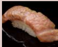
炙り大とろ Seared Fatty Tuna 火炙多脂金枪鱼肚腩