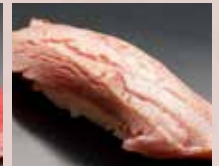
炙りとろ Seared Tuna Belly 火炙金枪鱼肚腩