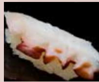
たこ Octopus 章鱼