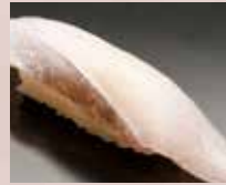
とろはまち Yellowtail Belly 黄尾鱼肚腩