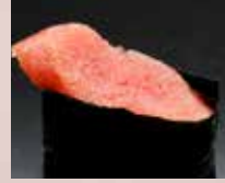
たらこ Codfish Roe 鱈鱼子