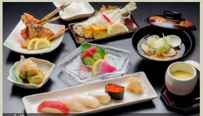
うめ 梅〈全8品〉 Kaiseki Course Ume (8 items) Ume Course (8 items) ¥3,500 梅 会席套餐 (全8品) 3,500円