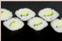
かっぱ巻 150円 Cucumber Roll 黄瓜卷