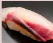
はまち Yellowtail 黄尾鱼