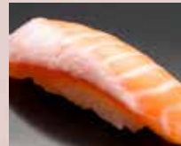
とろサーモン Fatty Salmon 三文鱼肚腩