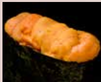
うに Sea Urchin 海胆