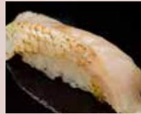
炙りのどぐろ Seared Blackthroat 火炙赤鲑鱼