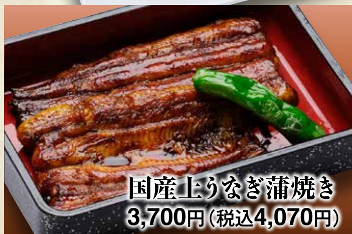
国産上りなぎ蒲焼き 3,700円(税込4,070円)