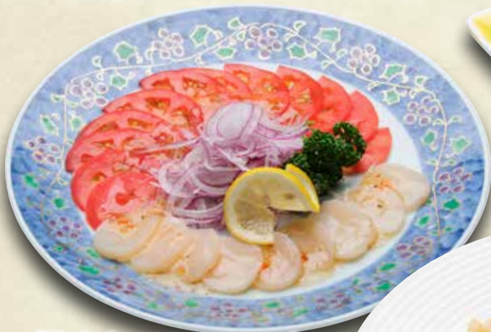
帆立とトマトのサラダ 800円(税込880円)