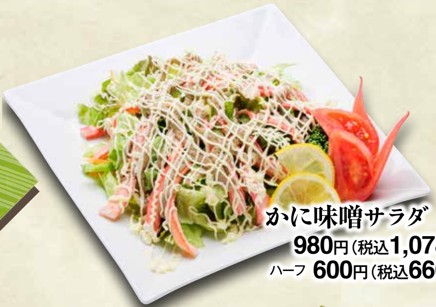
かに味噌サラダ 980円(税込1,078円) ハーフ 600円(税込660円)