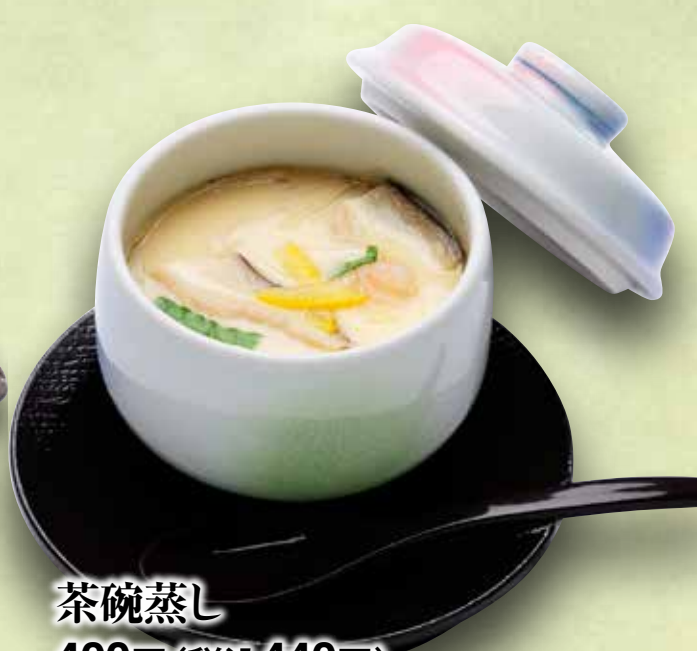
茶碗蒸し 400円(税込440円)