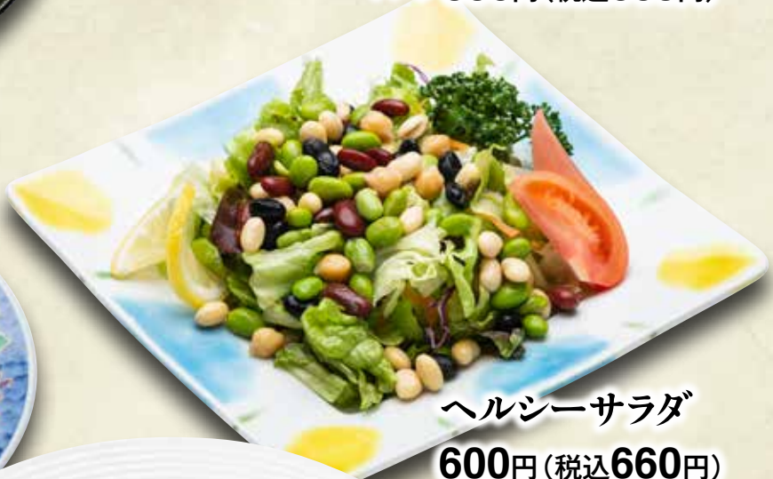
ヘルシーサラダ 600円(税込660円)