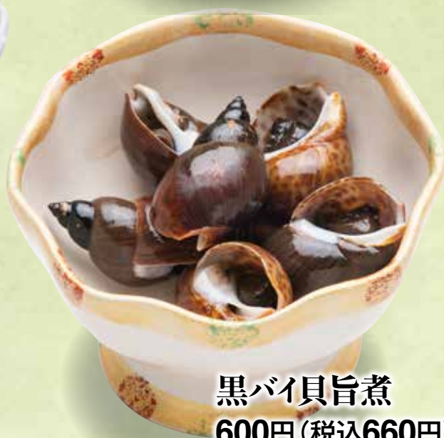
黒バイ貝旨煮 600円(税込660円)