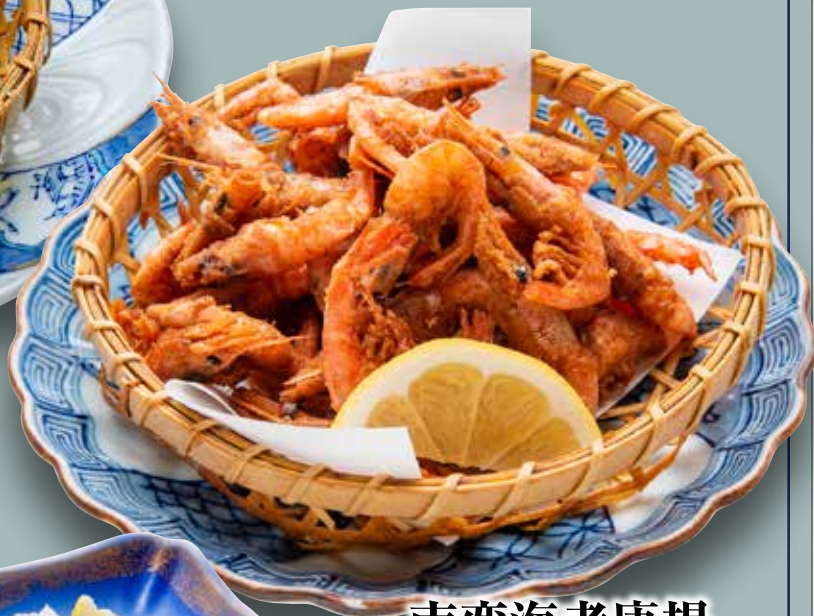
南蛮海老唐揚 600円(税込660円)