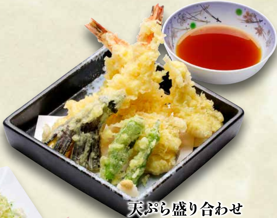
天ぷら盛り合わせ 1,000円(税込1,100円)