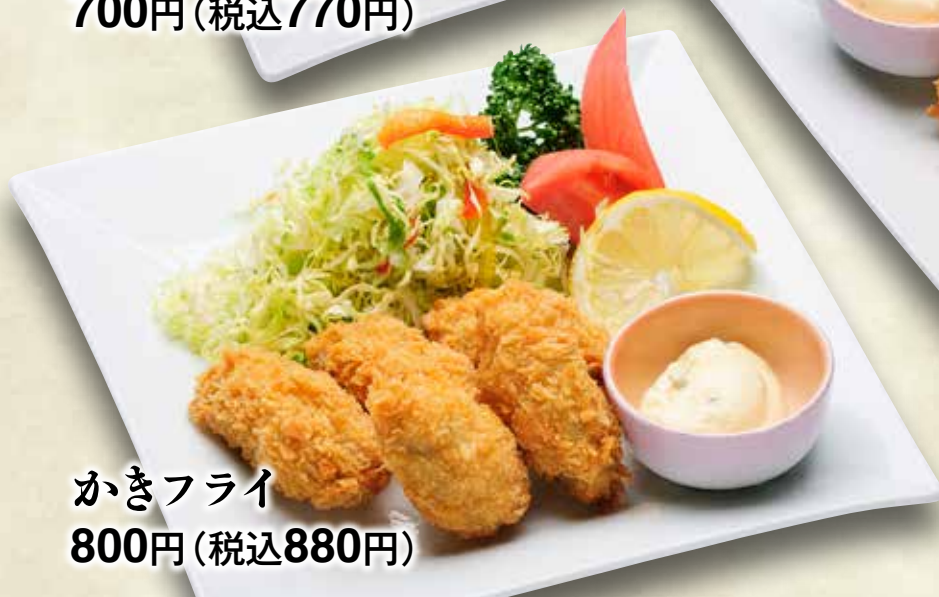
かきフライ 800円(税込880円)