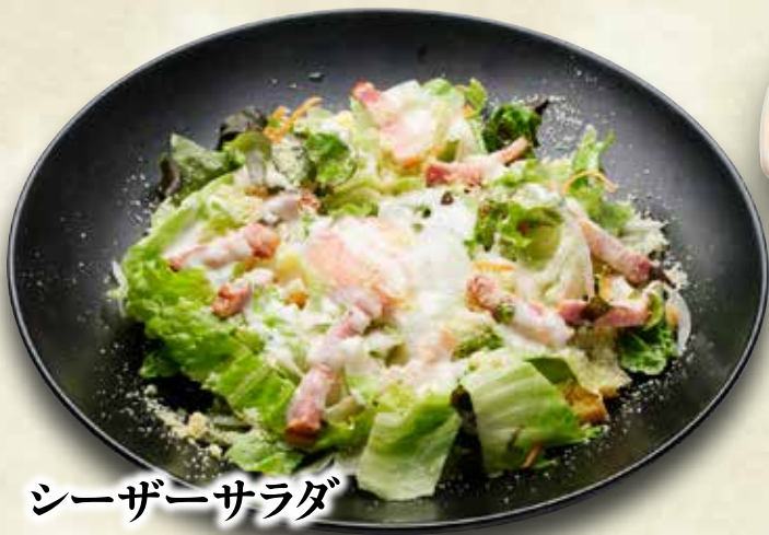
シーザーサラダ 600円(税込660円)