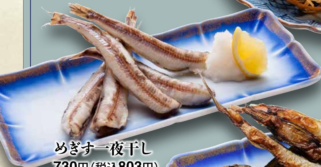
めぎす一夜干し 730円(税込803円)