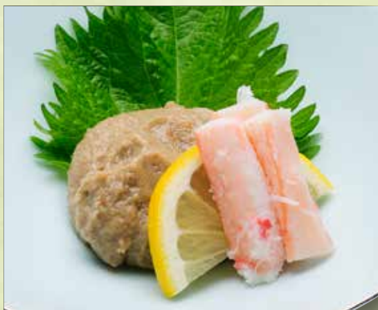
かに味噌つまみ 750円(税込825円)