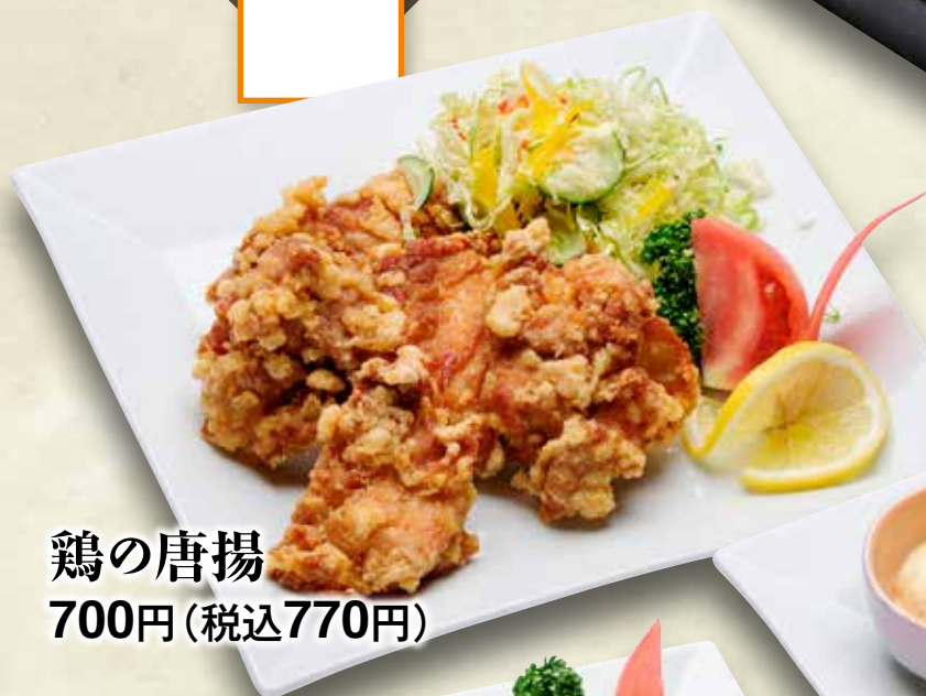
鶏の唐揚 700円(税込770円)