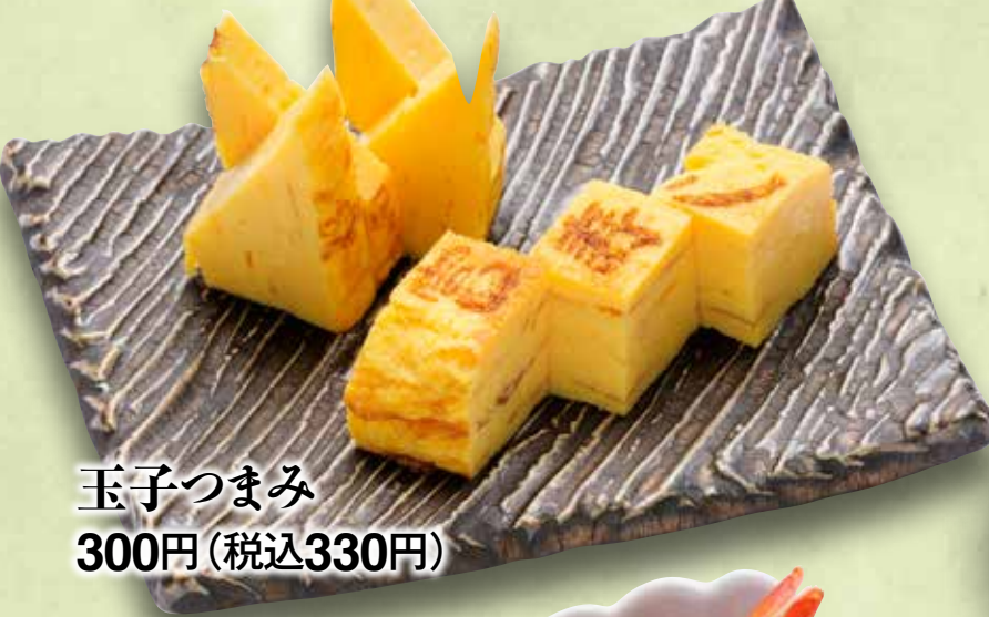
玉子つまみ 300円(税込330円)