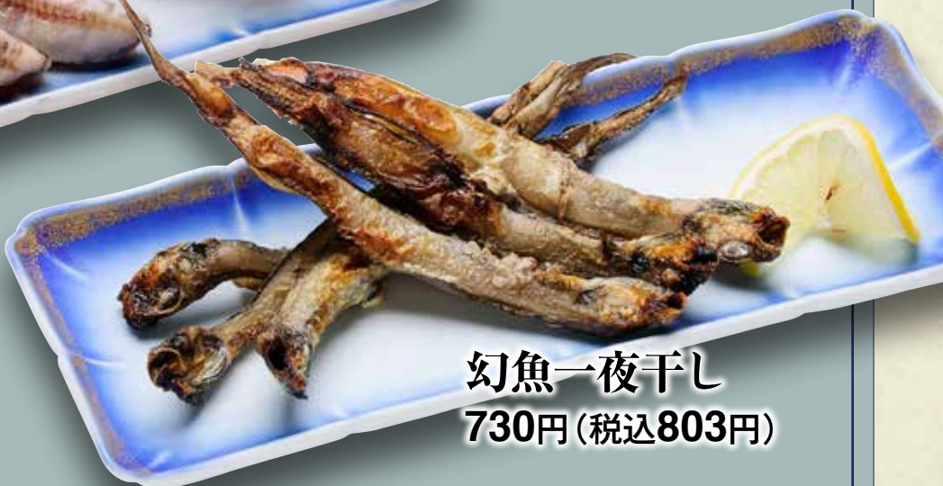
幻魚一夜干し 730円(税込803円)