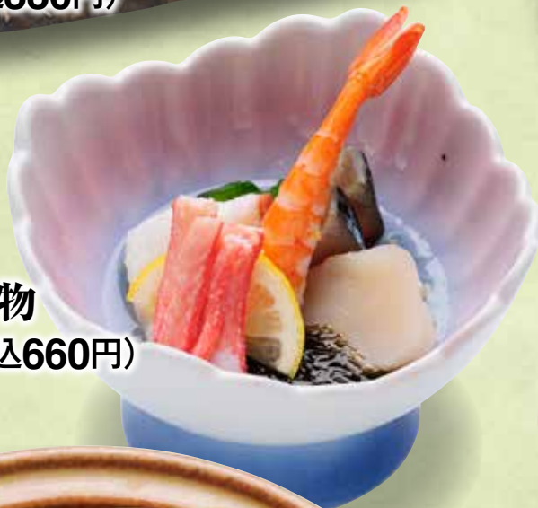
海鮮酢の物 600円(税込660円)