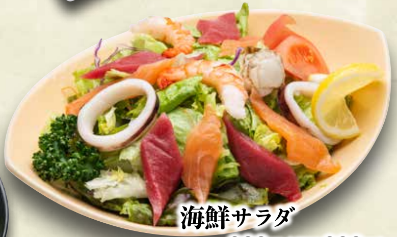
海鮮サラダ 900円(税込990円) ハーフ 550円(税込605円)