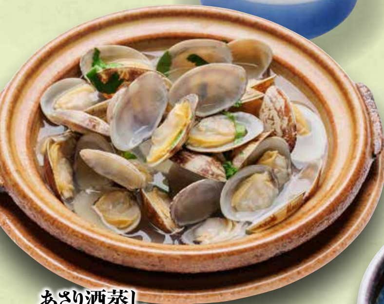
あさり酒蒸し 500円(税込550円)