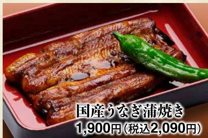
国産りなぎ蒲焼き 1,900円(税込2,090円)