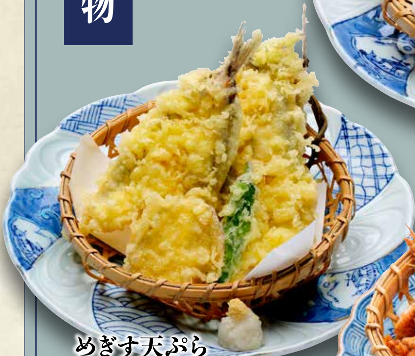
めぎす天ぷら 680円(税込748円)