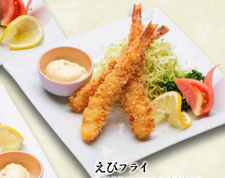
えびフライ 1,200円(税込1,320円)