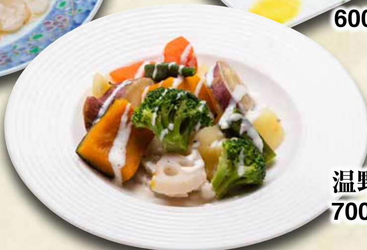
温野菜サラダ 700円(税込770円)