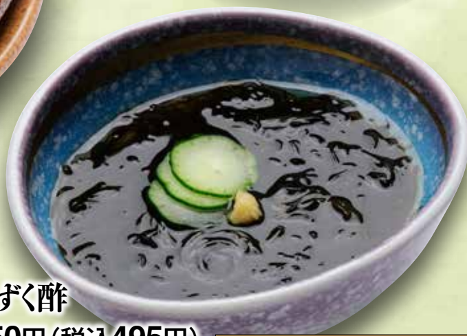
もずく酢 450円(税込495円)