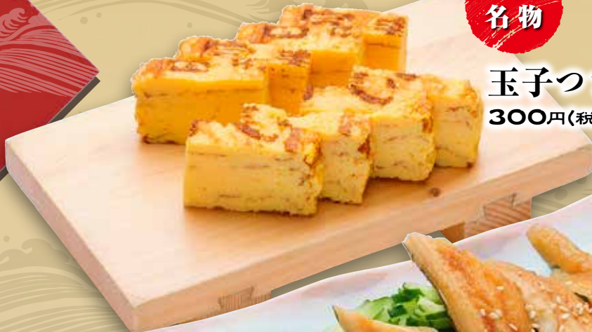
玉子つまみ 300円(税込330円)