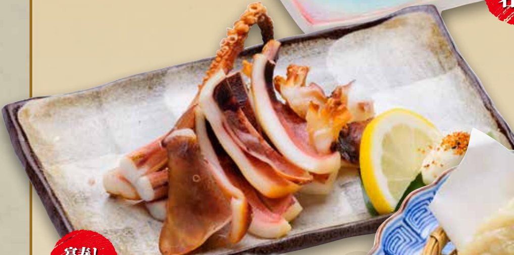
するめいか一夜干し 750円(税込825円)