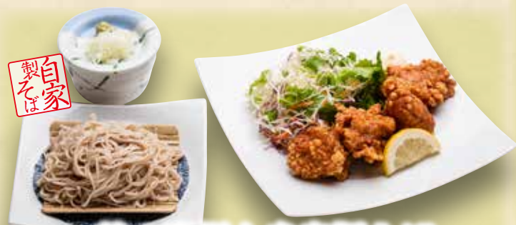
鶏の唐揚げと自家製そば 850円(税込935円)