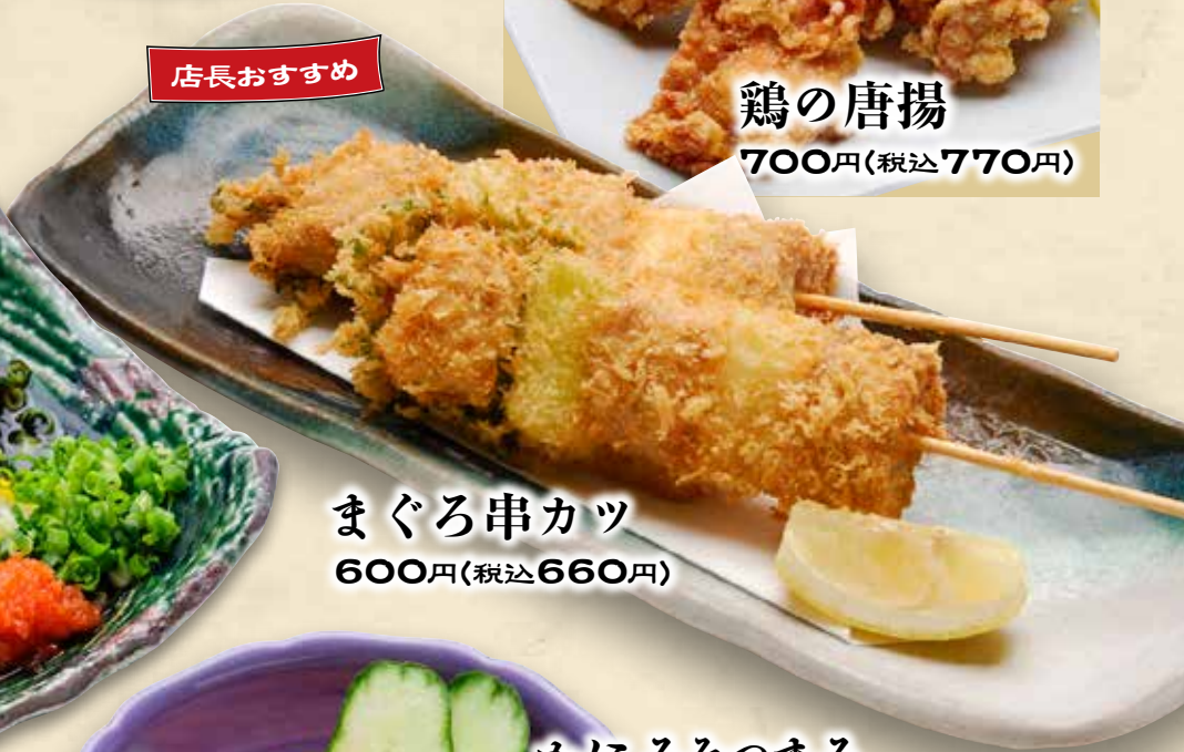
まぐろ串カツ 600円(税込660円)