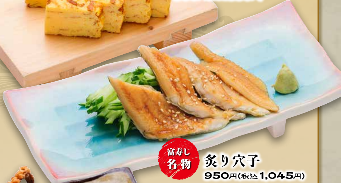
炙り穴子 950円(税込1,045円)