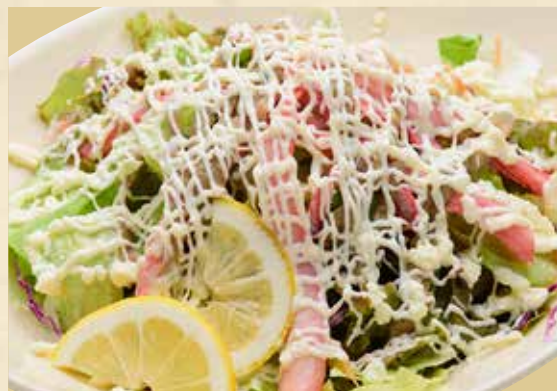
かに味噌サラダ 900円(税込990円) かに味噌サラダ ハーフ 500円(税込550円)