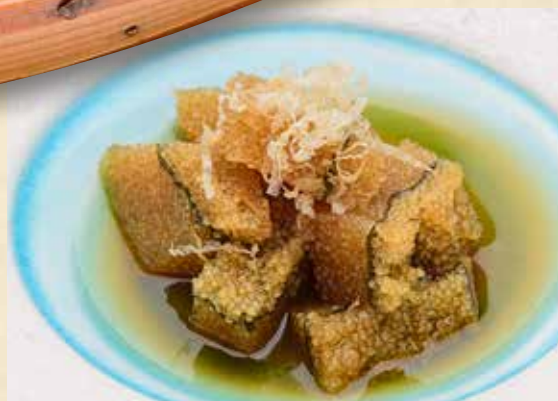
子持ち昆布つまみ 650円(税込715円)