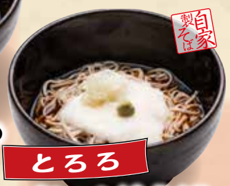
とろろ ぶっかけそば 680円(税込748円)