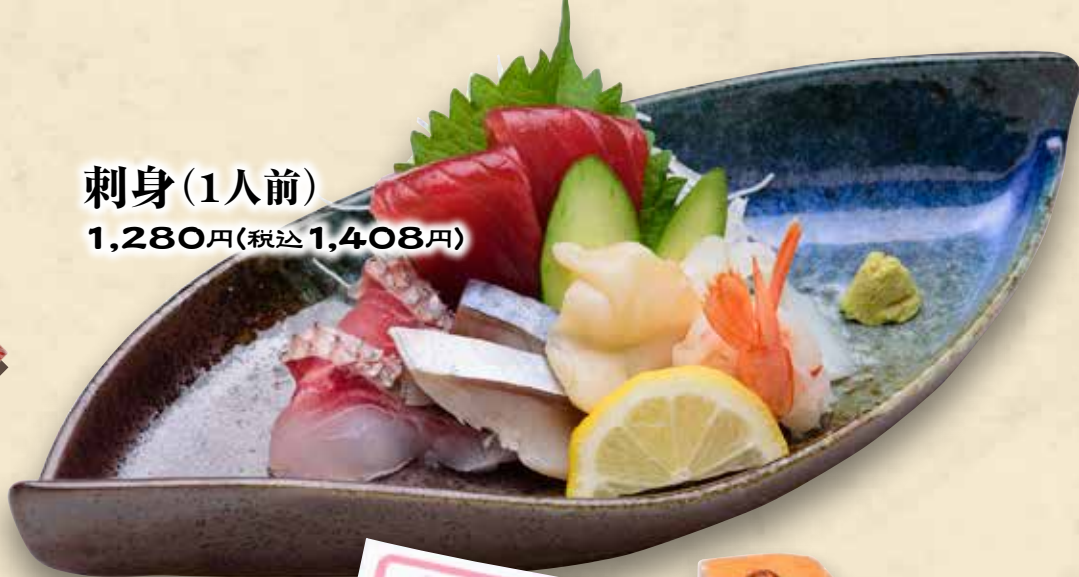
刺身(1人前) 1,280円(税込1,408円)