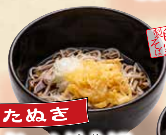
たぬき ぶっかけそば 680円(税込748円)