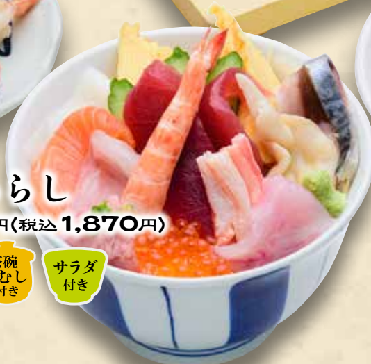
大漁ちらし 1,700円(税込1,870円)