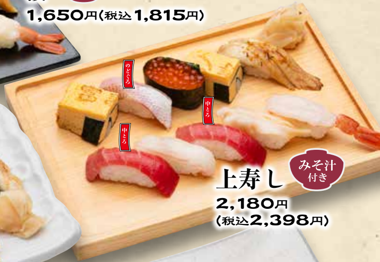
上寿司 みそ汁付き 2,180円 (税込2,398円)