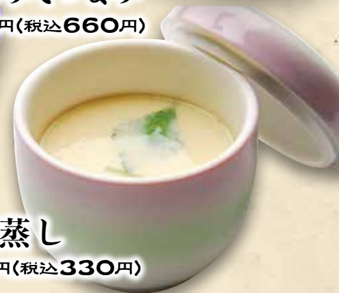
茶碗蒸し 300円(税込330円)