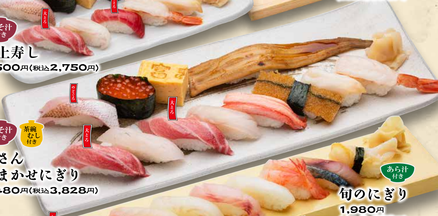
みそ汁付き 茶碗むし付き 板さん おまかせにぎり 3,480円(税込3,828円)