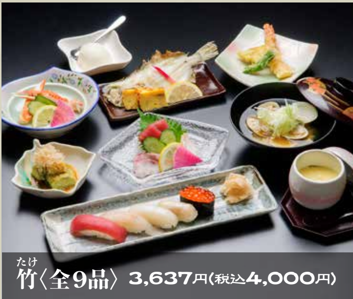
たけ 竹〈全9品〉 3,637円(税込4,000円)