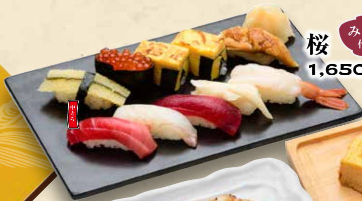
桜 みそ汁付き 1,650円(税込1,815円)