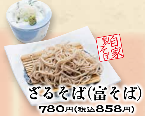
ざるそば(富そば) 780円(税込858円)