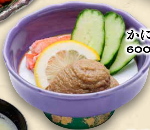
かにみそつまみ 600円(税込660円)