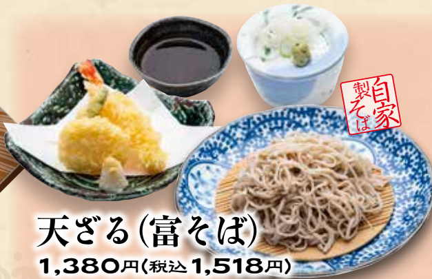
天ざる(富そば) 1,380円(税込1,518円)