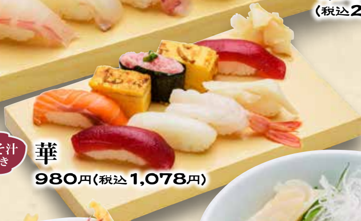
みそ汁付き 華 980円(税込1,078円)