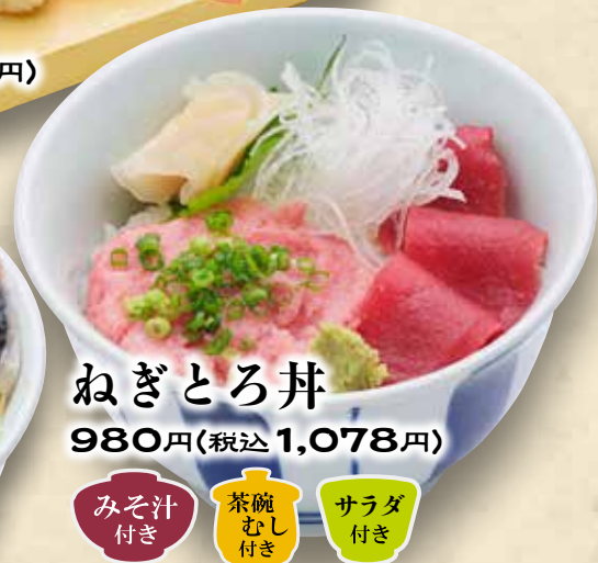
ねぎとろ丼 980円(税込1,078円)