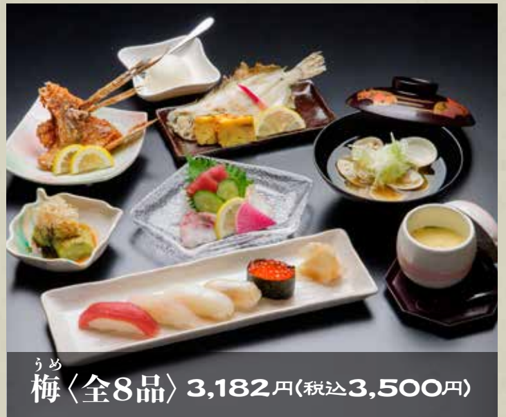
うめ 梅〈全8品〉 3,182円(税込3,500円)