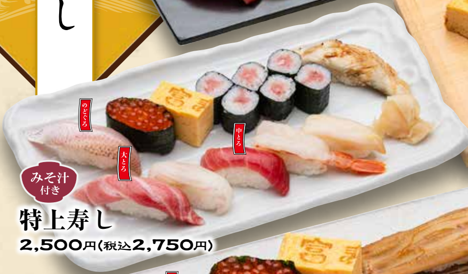
みそ汁付き 特上寿司 2,500円(税込2,750円)