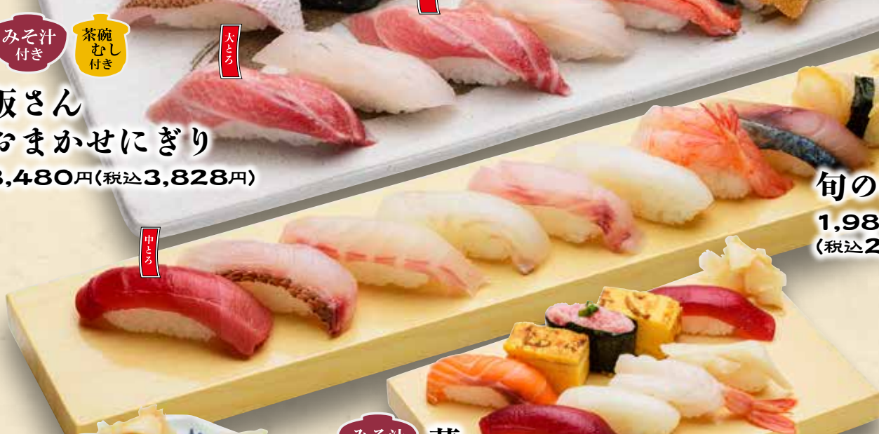
あら汁付き 旬のにぎり 1,980円 (税込2,178円)