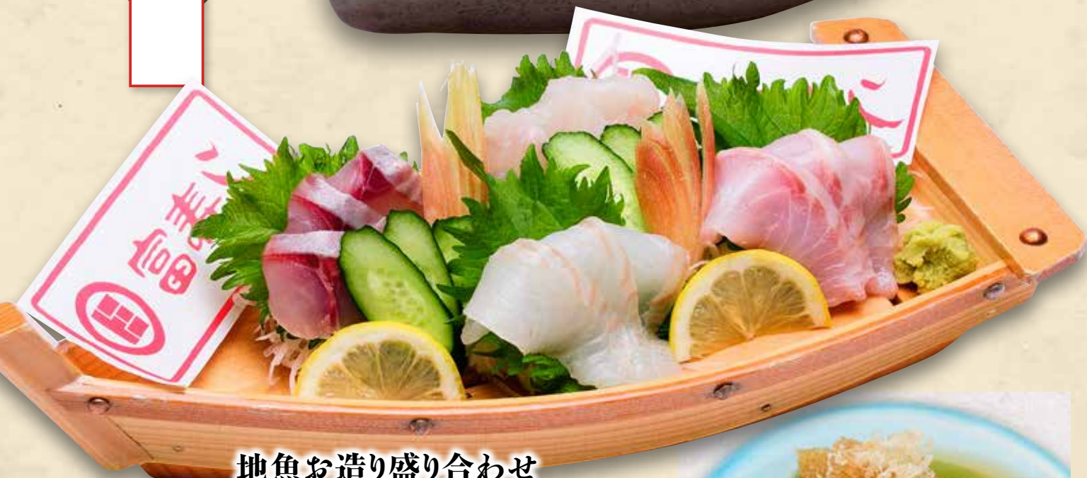
地魚お造り盛り合わせ (1~2人前) 2,500円(税込2,750円)