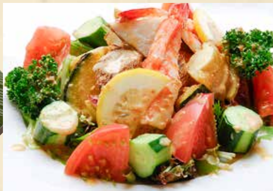
ゴロゴロ揚げ根菜のゴマダレサラダ 750円(税込825円)