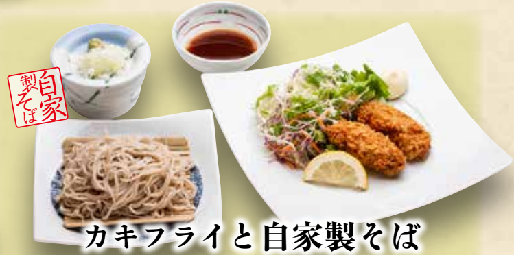
カキフライと自家製そば 900円(税込990円)