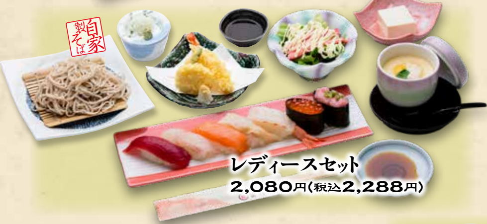
レディースセット 2,080円(税込2,288円)