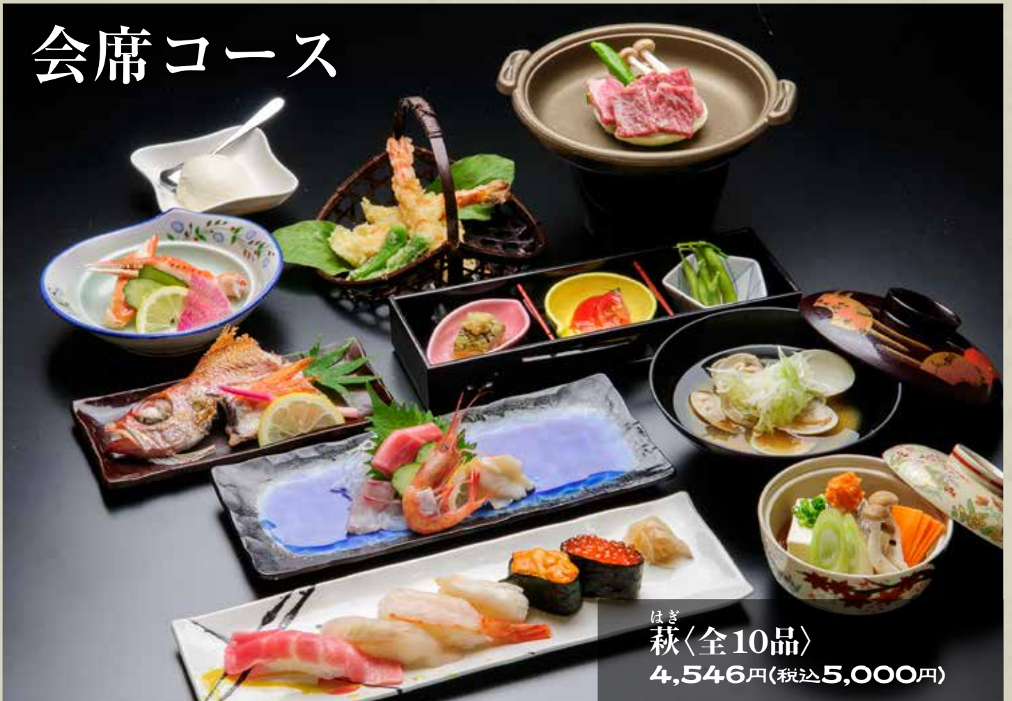
ほぎ 萩〈全10品〉 4,546円(税込5,000円)