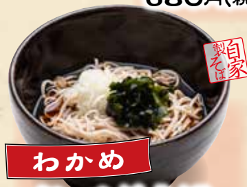
わかめ ぶっかけそば 680円(税込748円)